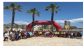
Rodajoc i Rodaesport

Col·laborem amb les Universitats formadores de mestres