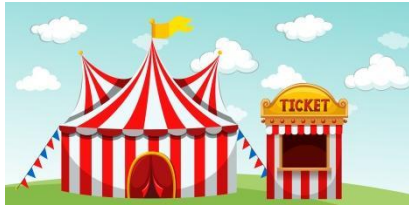
Projecte STEAMcat: "Benvinguts al Circ Tramuntana"