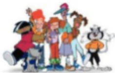
Programa "Sigues tu" (habilitats bàsiques per la vida)