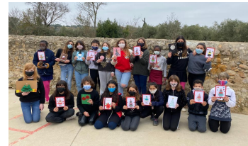
Amic o amiga de ZER