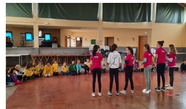
Pla Català de l'Esport Escolar