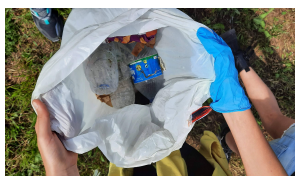
Treball d'hàbits saludables: consum de fruita, hort, reciclatge, estalvi energètic...