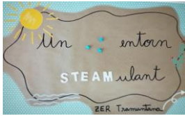
Projecte STEAMcat: "Un entorn STEAMulant"