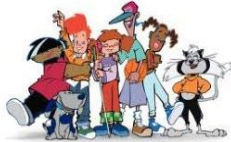
Programa "Sigues tu" (habilitats bàsiques per la vida)