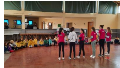
Pla Català de l'Esport Escolar