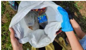
Treball d'hàbits saludables: consum de fruita, hort, reciclatge, estalvi energètic...