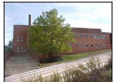
ESCOLA JOAN DE PALÀ La Coromina (Cardona)