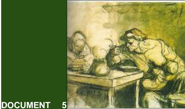
DOCUMENT 5 sopa, dibuix