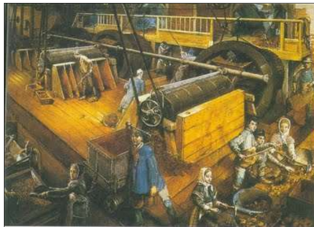
Dones en un taller de zenc, França, 1860