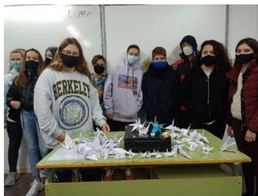
Alumnat de 2n d'ESO

La Marató de TV3 d'aquest curs ha estat dedicada a la Covid-19. A partir del segon cicle d'ESO rebem una xerrada en relació la malaltia tractada. Aquest curs ha estat a través de la pantalla.