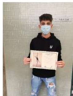
2n cicle d'ESO