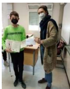
1r cicle d'ESO