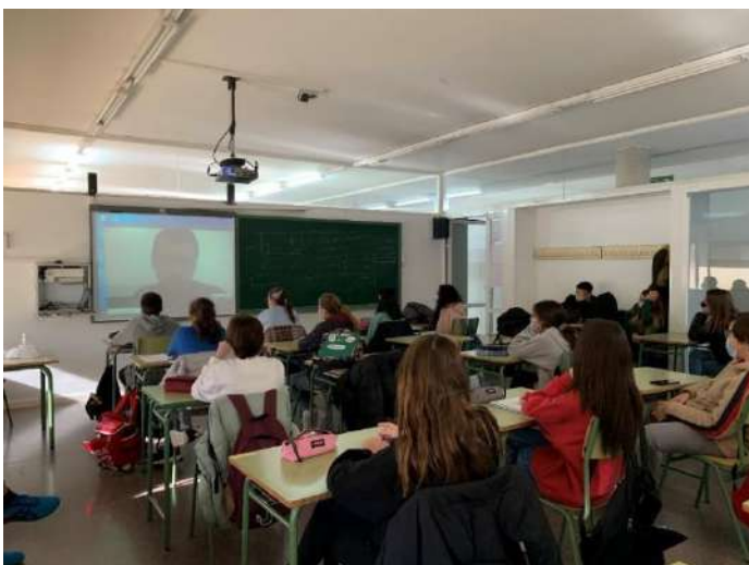
Alumnat de 4t d'ESO

La Marató de TV3 d'aquest curs ha estat dedicada a la Covid-19. A partir del segon cicle d'ESO rebem una xerrada en relació la malaltia tractada. Aquest curs ha estat a través de la pantalla.