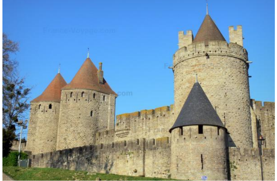
Cité de Carcassonne