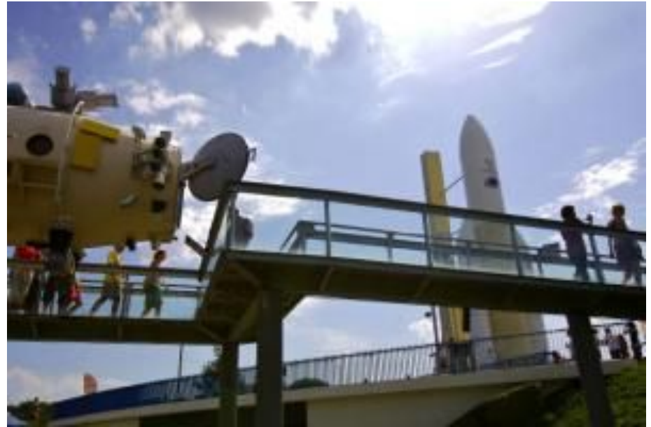
Cité de l’Espace