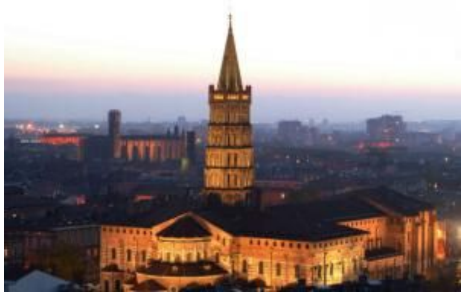
Vue de Toulouse

17:30 Tornada a l'alberg, temps lliure sopar i temps lliure a l'alberg.