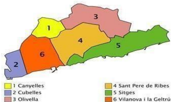
Fig. 1: Comarca del Garraf

Cubelles és una vila costanera, situada al sud de la comarca del Garraf d'uns 15.700 habitants. Limita amb Vilanova i la Geltrú, capital de la comarca.