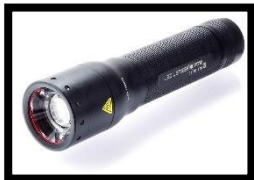
llanterna / lot

Si NO us heu pogut connectar a la Videotrucada, inventeu-vos una història on apareguin els següents objectes: