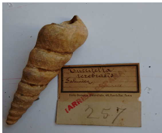
Fig.3 Turritella procedent de París