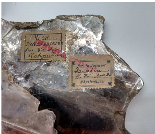
Fig.2 Mica argentina, donació

Pel que hem vist a les etiquetes, hi ha una remesa d'exemplars que provenen de París, del gabinet del naturalista Emile Deyrolle amb botiga a 46, Rue du Bac. Tal vegada fou una forma de començar la col·lecció amb una certa entitat