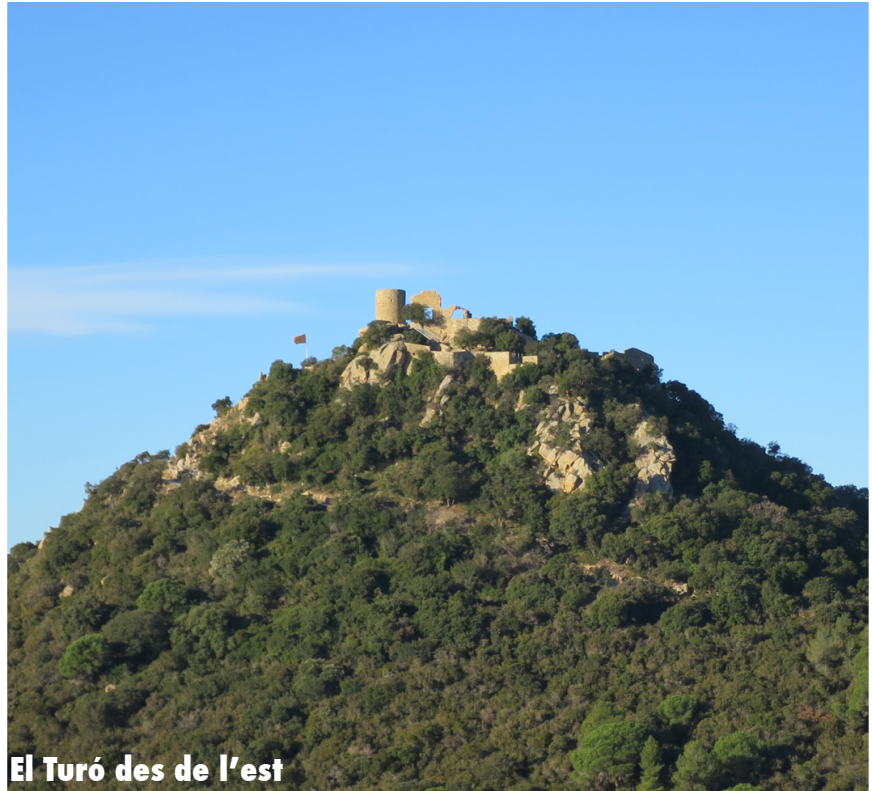
El Turó des de l'est

Actualment el Turó de Burriac surt a la llista dels 100 cims de la FECC ( cim essencial ). Podem trobar ressenyes per accedir a aquest turó des de diversos indrets. Els més populars tenen el seu punt de partida a la Font Picant de Cabrera o bé a la Font Picant d'Argentona.