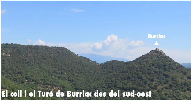
El coll i el Turó de Burriac des del sud-oest