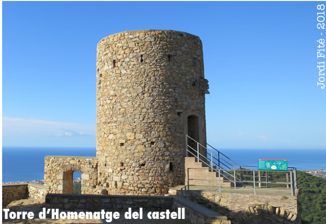
Torre d'Homenatge del castell