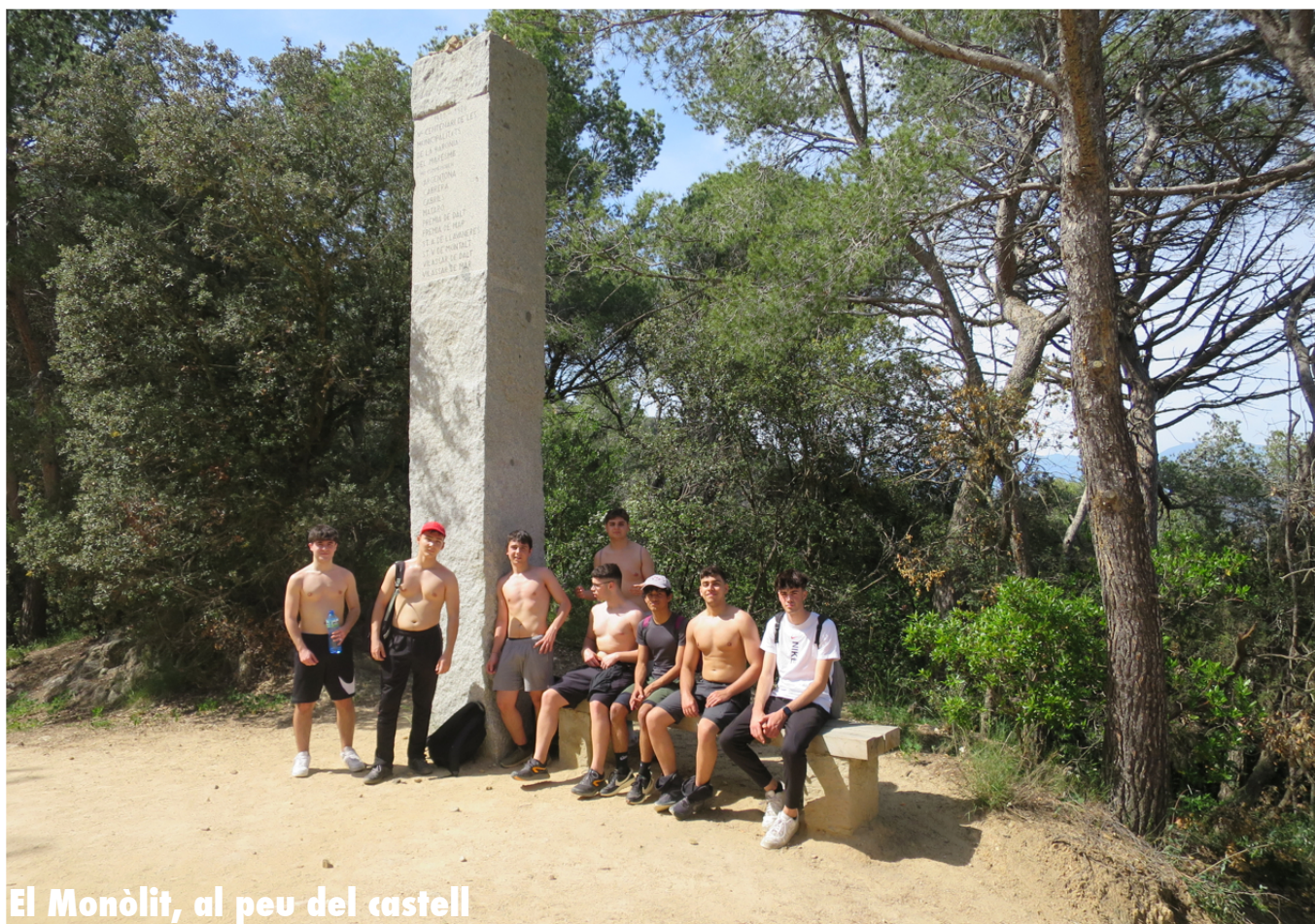
El Monòlit, al peu del castell