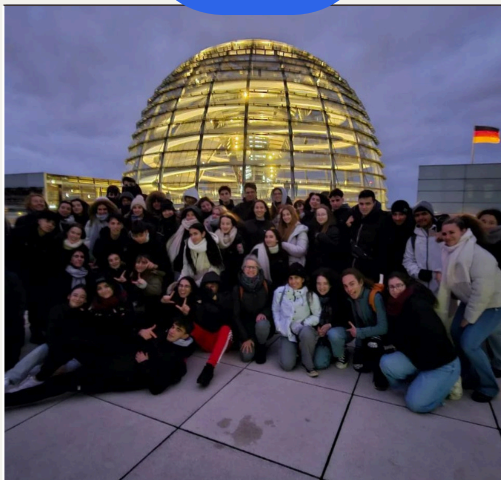
Viatge a Berlín