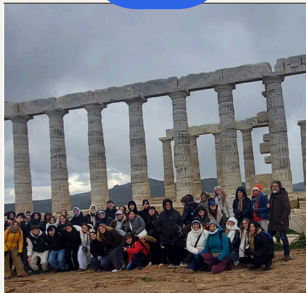
Viatge a Grècia