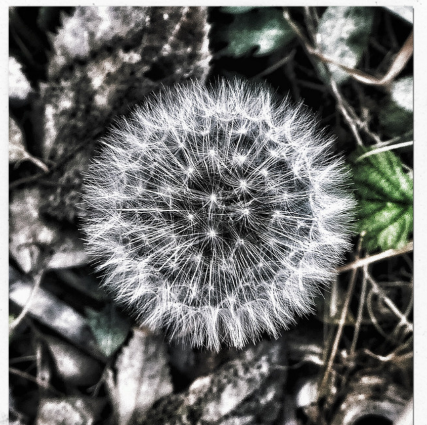
Esfera natural JOAN BELMONTE (2019)