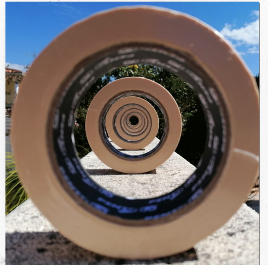
Cercles periòdics FERRAN FIGUEROLA (2020)