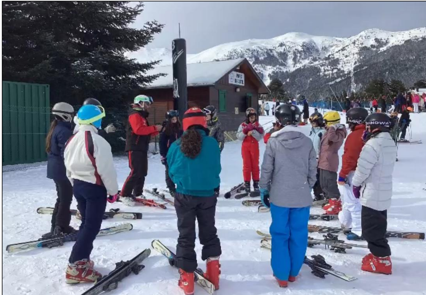
Esquiada de 2n ESO