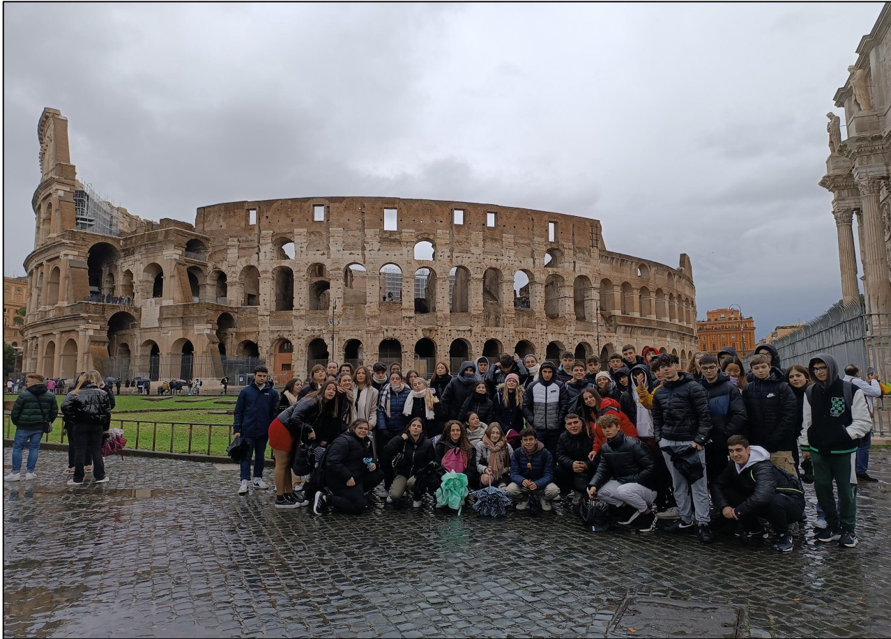
Viatge Roma 2n de Batxillerat