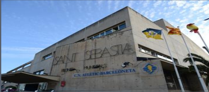
CN ATLÈTIC BARCELONETA CN BARCELONA