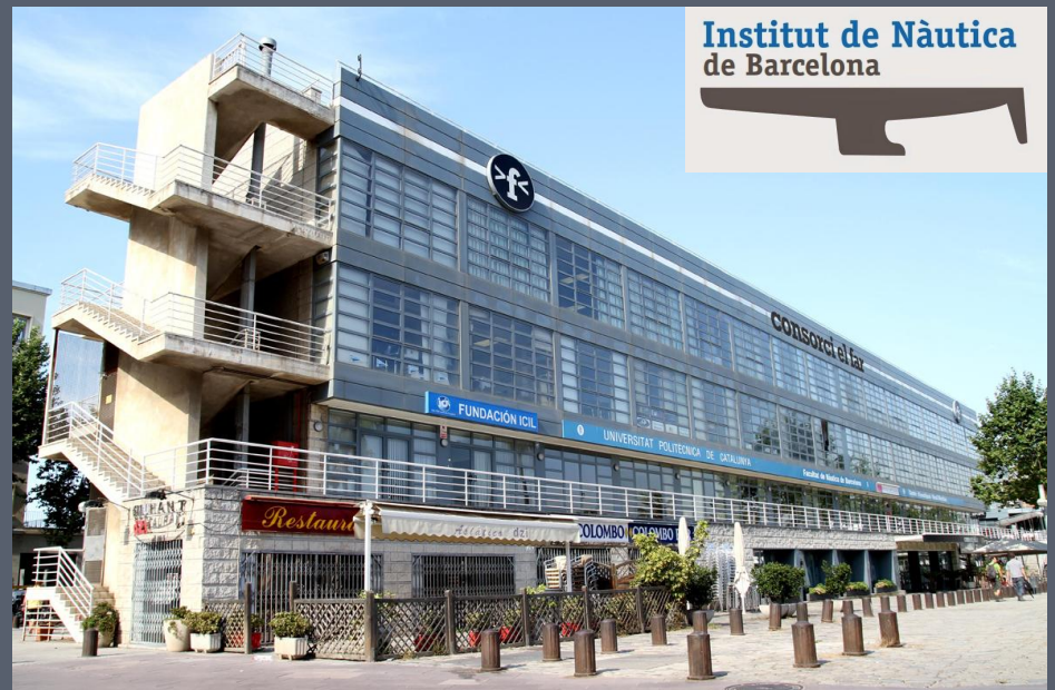
Institut de Nàutica de Barcelona