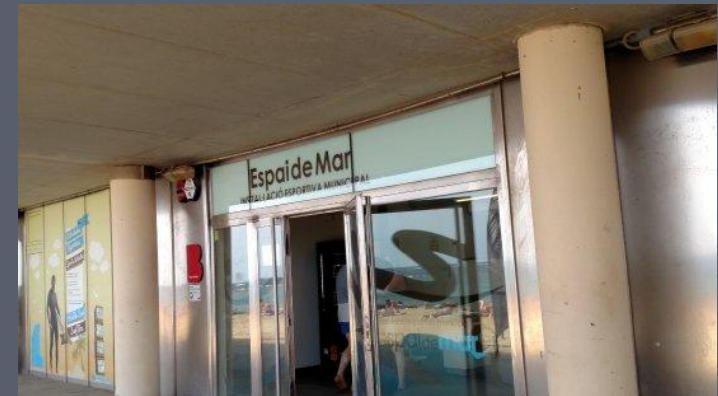
ESPAI DE MAR