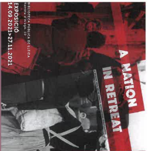
Disseny cartell: Eric Forcada - Nicolas Giridès