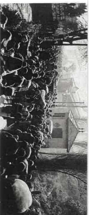
Archives Départementales des Pyrénées Orientales (Perpinyà)