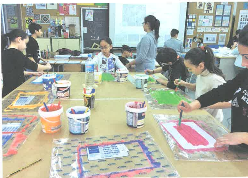
Imatge 2. Activitat compartida de plàstica organitzada per la professora de dibuix de secundària per a l'alumnat de sisè i amb la col·laboració de l'alumnat d'ESO

El model d'institut escola ens permet generar confiança entre les famílies, amb la qual cosa n'afavorim el sentit de pertinença i la participació. És un model que ens ajuda a millorar el funcionament i a desenvolupar projectes globals, de qualitat i d'innovació, i que ens permet apropar les cultures de primària i secundària i avançar en