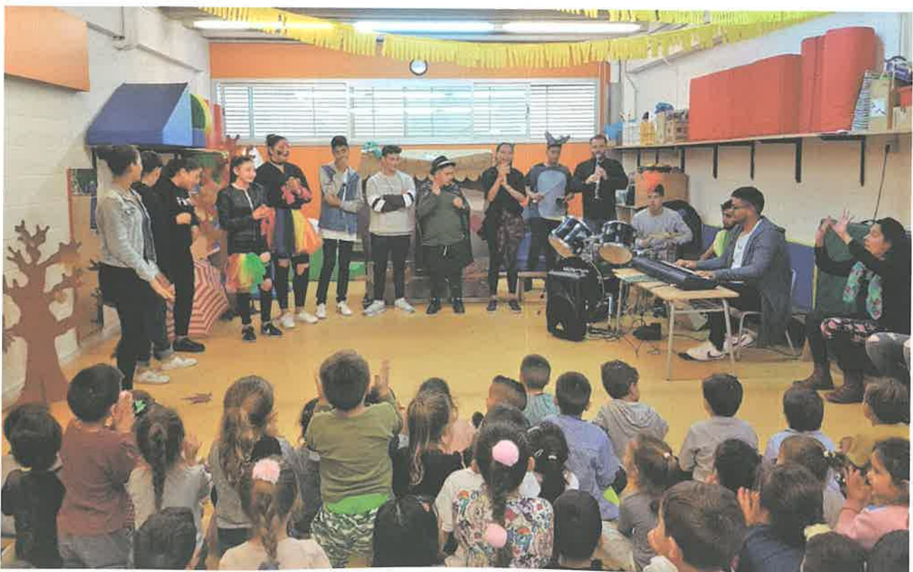
Imatge 1. Projecte Aprenem ensenyant