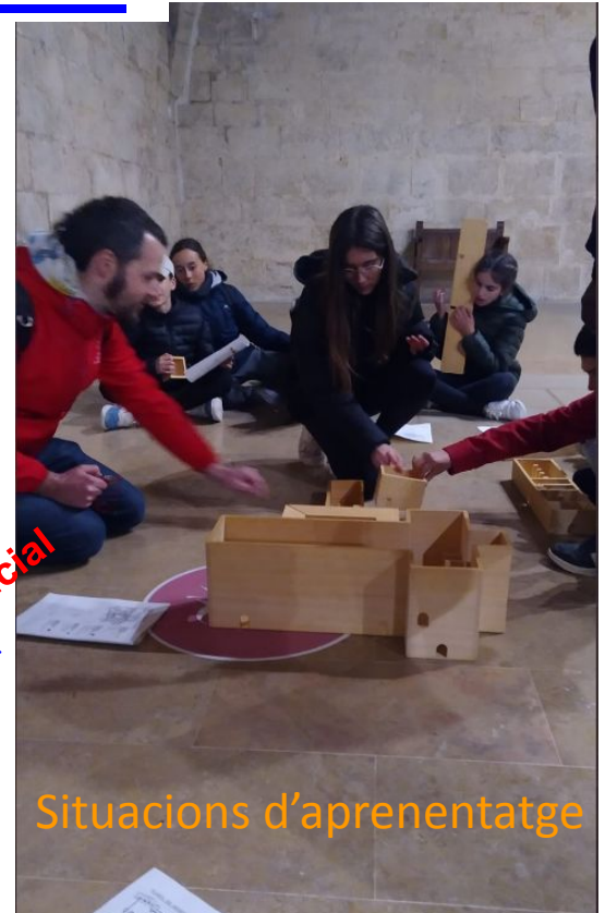
Aprentatge competencial Hàbit lector