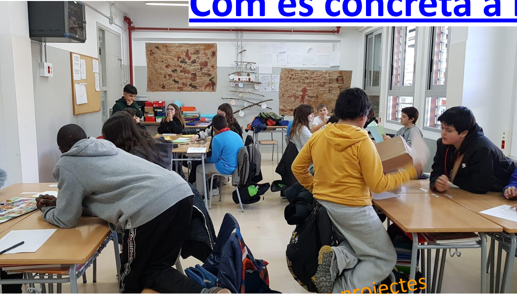
Aprentatge basat en projectes