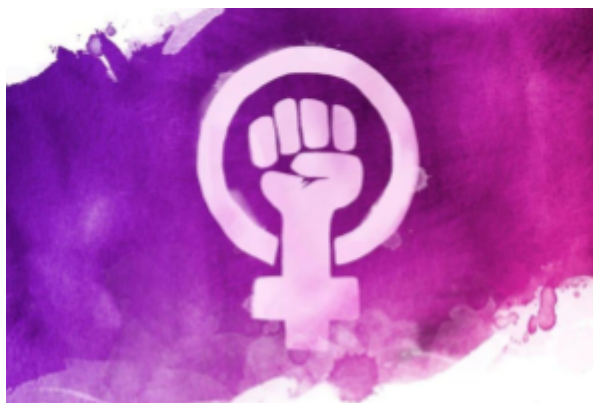
Fig 1. Símbol de la lluita feminista

Per altra banda, a llibres com "Feminismo para principiantes" de Nuria Varela 3 , es defineix el feminisme com a una teoria política articulada per dones que prenen consciència de la realitat en què viuen i les discriminacions pel motiu de ser dones i decideixen organitzar-se per canviar la societat.