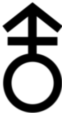
Fig 14. Símbol que representa l'androgínia

Per tant, Virginia Woolf aplica la androgínia en l'àmbit literari i, a partir d'això, ho extreu cap a l'ideal feminista. Aquesta teoria, és el que diferencia l'autora de la resta de feministes de l'època i posteriors ja que no es basa en una separació de gèneres sino en una unió.