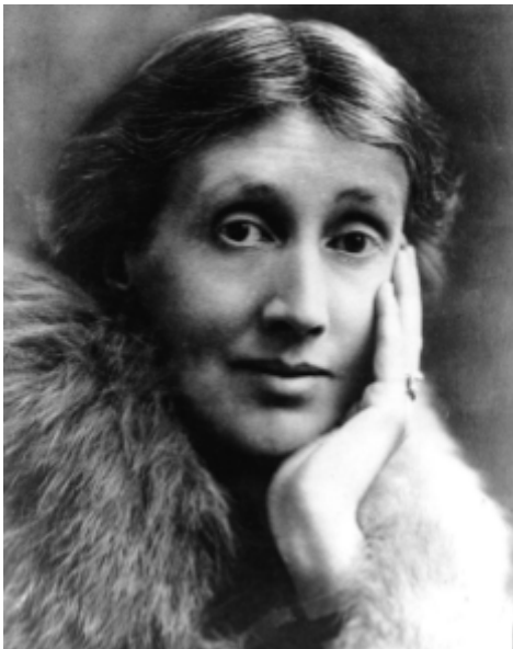
Fig 7. Virginia Woolf