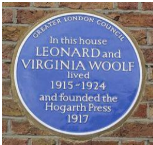
Fig 8. Placa commemorativa a 'Hogarth House'.

L'editorial va tenir molt prestigi i va publicar fins a 527 obres, incloent-hi títols de Sigmund Freud i T.S. Eliot. Actualment, i des de 1987, el segell creat per l'escriptora anglesa forma part de la multinacional Random House; ja que, Chatto & Windus va deixar de ser una editorial independent.