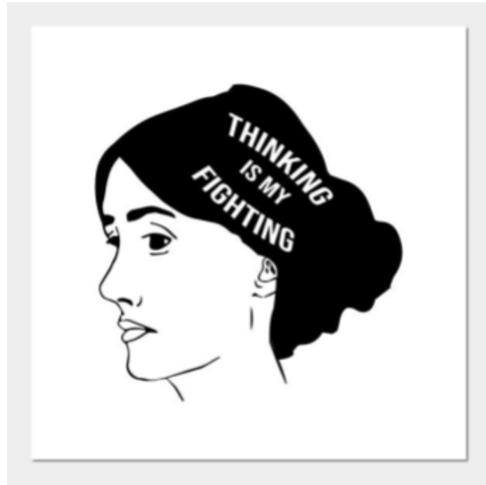
Fig 17. Il·lustració que representa la lluita intel·lectual de Woolf