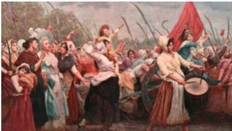
Fig 2. Marxa de Versalles (1789)

El moviment feminista es pot dividir en tres onades; la primera es remunta als inicis del moviment, a la Revolució Francesa, quan les dones es van començar a qüestionar seriosament perquè eren excloses de la ciutadania i del dret a l'educació.