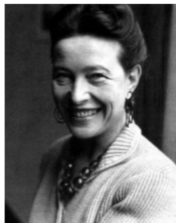
Fig 4. Simone de Beauvoir