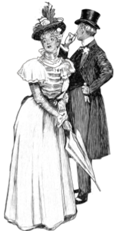
Fig 12. Il·lustració que representa la dualitat de gènere d'Orlando

A causa d'aquest canvi de sexe, es fan reflexions sobre la condició femenina als diferents segles en els quals transcorre la biografia i es compara amb el tipus de vida que tenia l'home. Orlando, encara que canviï d'entorn o de gènere, manté la seva essència durant tot el llibre; és un personatge que busca la seva pròpia plenitud vital.