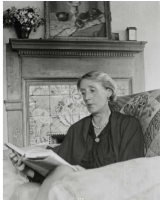
Fig 16. Virginia Woolf

Virginia Woolf no és radical, no és activa revolucionàriament ni surt a manifestar-se; Virginia Woolf lluita i defensa la postura de la dona i la seva importància a partir de la literatura, escriu i mostra la realitat femenina amb llibres, assaigs... Utilitza