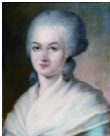
Fig 3. Olympe de Gouges

La segona onada va començar a la dècada de 1900 amb les sufragistes, unes dones que lluitaven per aconseguir el dret a vot del gènere femení i després de molta paciència, a finals del segle XIX i principis del XX, van aconseguir el seu objectiu. En aquesta onada també es va començar a incloure a les dones a l'església i, per altra banda, les dones van lluitar en contra de l'esclavitud creant diverses societats. Als Estats Units també es va crear Sèneca Falls, la primera convenció sobre els drets de les dones al país americà. En aquest mateix territori, es va crear l'Associació Nacional pro Sufragi de la Dona (NWSA) i l'Associació Americana pro Sufragi de la Dona (AWSA), aquestes dues potències van aconseguir el vot de la dona l'any 1920. En aquesta part del feminisme, també va ser publicat El Segon Sexe de Simone de Beauvoir on s'arriba a la conclusió de què no hi ha raons biològiques que expliquen la degradació del sexe femení.