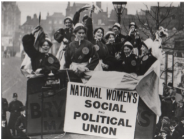
Fig 5. Women's Social and Political Union

El sufragisme va arribar en el seu total esplendor a Gran Bretanya l'any 1903 amb la creació de la Women Social and Political Union (WSPU) . Ara bé, anys abans, més