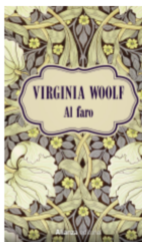
Fig 10. Portada de Al far (1927)