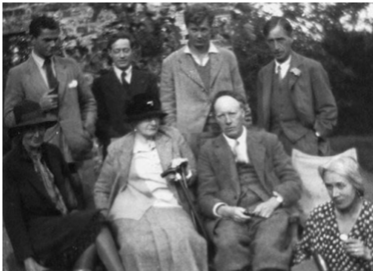
Fig 6. Cercle de Bloomsbury (Virginia Woolf a l'esquerra)

L'any 1905, Virginia Woolf va canviar de residència a Bloomsbury, just després de la mort del seu pare. La casa en la qual es va establir va ser un centre de reunions d'un grup del qual era membre, format per elitistes intel·lectuals britànics, tant homes com dones; entre els quals podem destacar Emmeline Pankhurst (anomenada anteriorment com a líder sufragista), Dora Carrington (destacada pintora), entre d'altres.