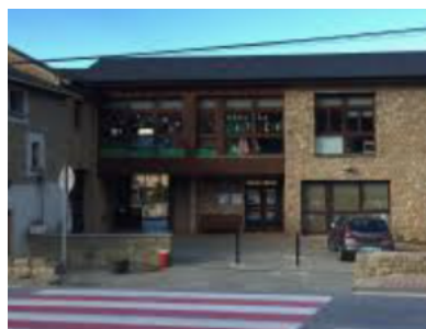
Escola Sant Serni (Prats i Sampsor)