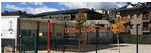
Escola Llums del Nord (Puigcerdà)