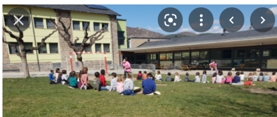
Escola Mare de Déu de Talló (Bellver)