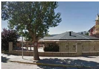
Escola Alfons I (Puigcerdà)