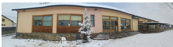
Zer Santa Coloma (Ger)