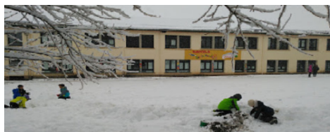
Escola Bac de Cerdanya (Alp)