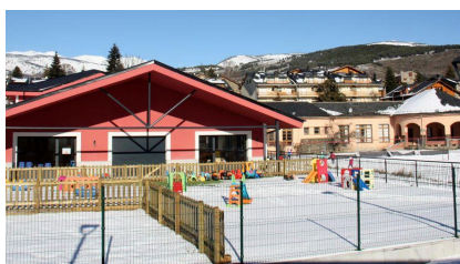
Zer Jaume I (Llívia)