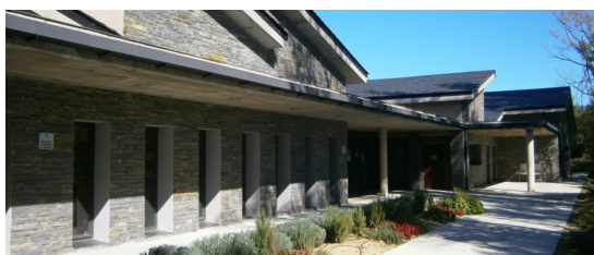
Zer Santa Cecília (Bolvir)