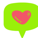
Potenciar sentiment de pertinença.