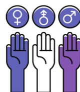
Inclusivitat Pluralitat Coeducació.