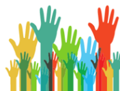
Foment de la participació.