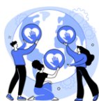
Aprenentatge Global i cooperatiu.