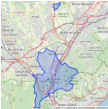
Fig 1: Àrea territorial de Montcada i Reixac.

Durant aquests anys, s'han impartit classes corresponents a les formacions acadèmiques dels successius sistemes educatius: des del Batxillerat Elemental, el Batxillerat Superior, el COU, el Batxillerat Unificat Polivalent (BUP) i, finalment, amb els actuals sistemes, l'Educació Secundària Obligatòria (ESO) i el Batxillerat. Fins al curs 2008-09 es va oferir també Batxillerat en règim de nocturn.