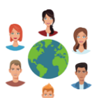
Foment llengua catalana. Impuls llengües estrangeres.