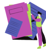
Revisió documents de centre.