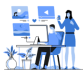
Estratègia digital de centre.