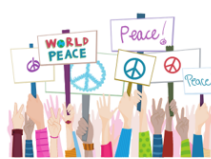
Tolerància zero a la Violència. Cura de les persones.