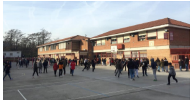
Fig 2: Imatge del pati de l'institut