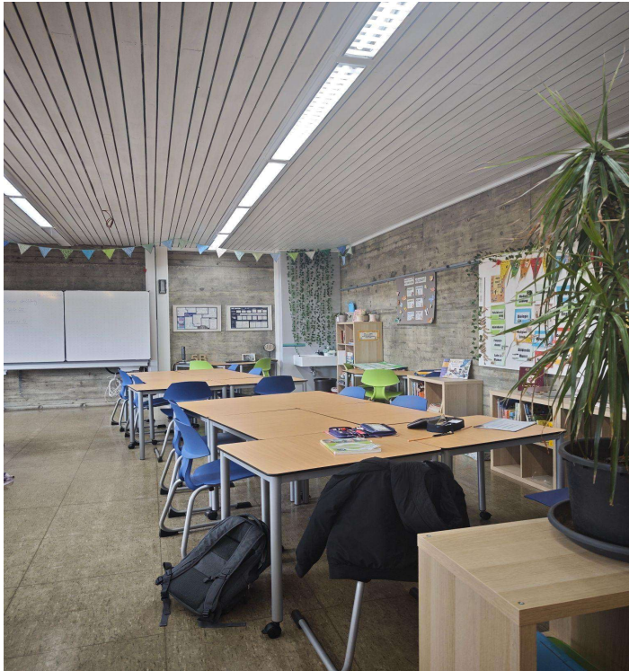
Aula de suport entre iguals "Lernbüro"

desenvolupin les seves fortalezes, assumeixin responsabilitats i creixin com a persones dins d'un entorn educatiu que confia plenament en ells.