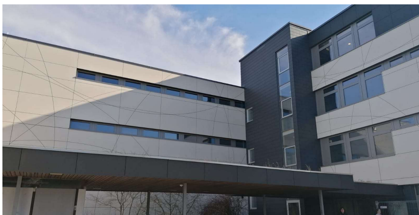
Vista exterior del Gymnasium

Aquest informe recull els principals aspectes treballats durant l'estada i reflexiona sobre el seu possible impacte i transferibilitat al nostre centre.