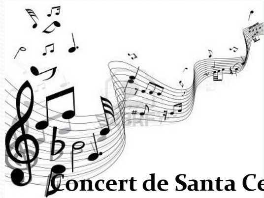
Concert de Santa Cecília