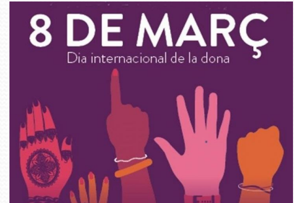
8 DE MARÇ Dia internacional de la dona