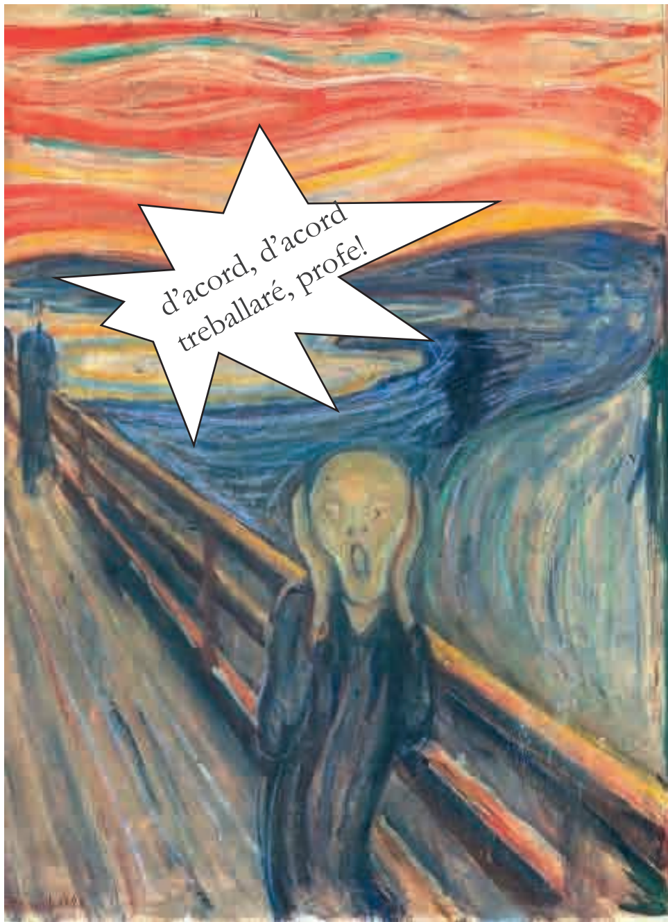
Pintor: Munch Nom de l'obra: El crit any: 1893 Estil: Expressionisme