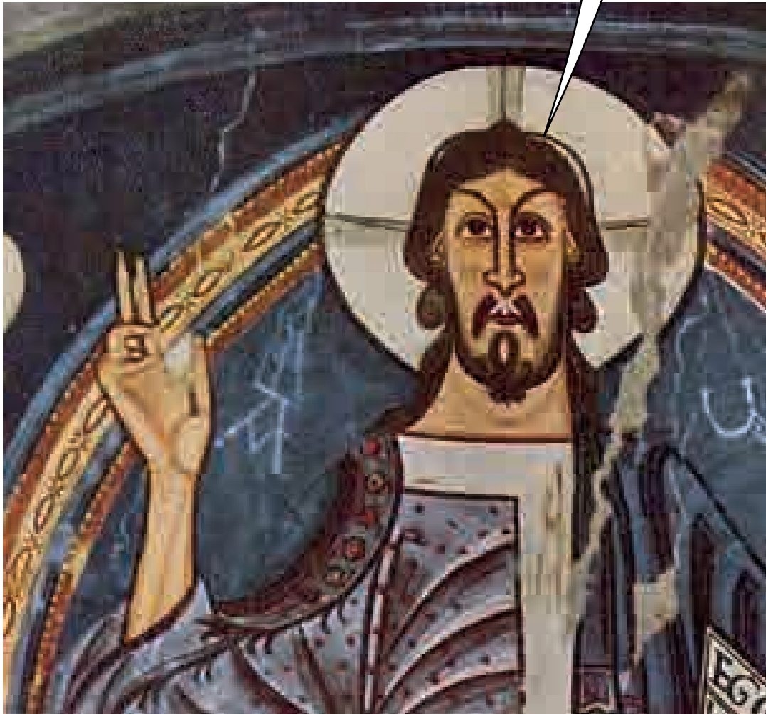
Nom de l'obra: Pantocràtor de l'església de Taüll any: 1123 Estil: Romànic

Escriviu-me en 5/10 línies què heu volgut representar i què simbolitza. No cal que escriviu objecte per objecte. IMPORTANT: la qualitat de foto. Podeu utilitzar els prestatges de casa per ficar-hi els objectes com si fos un museu. També podeu fer l'activitat amb un vídeo.