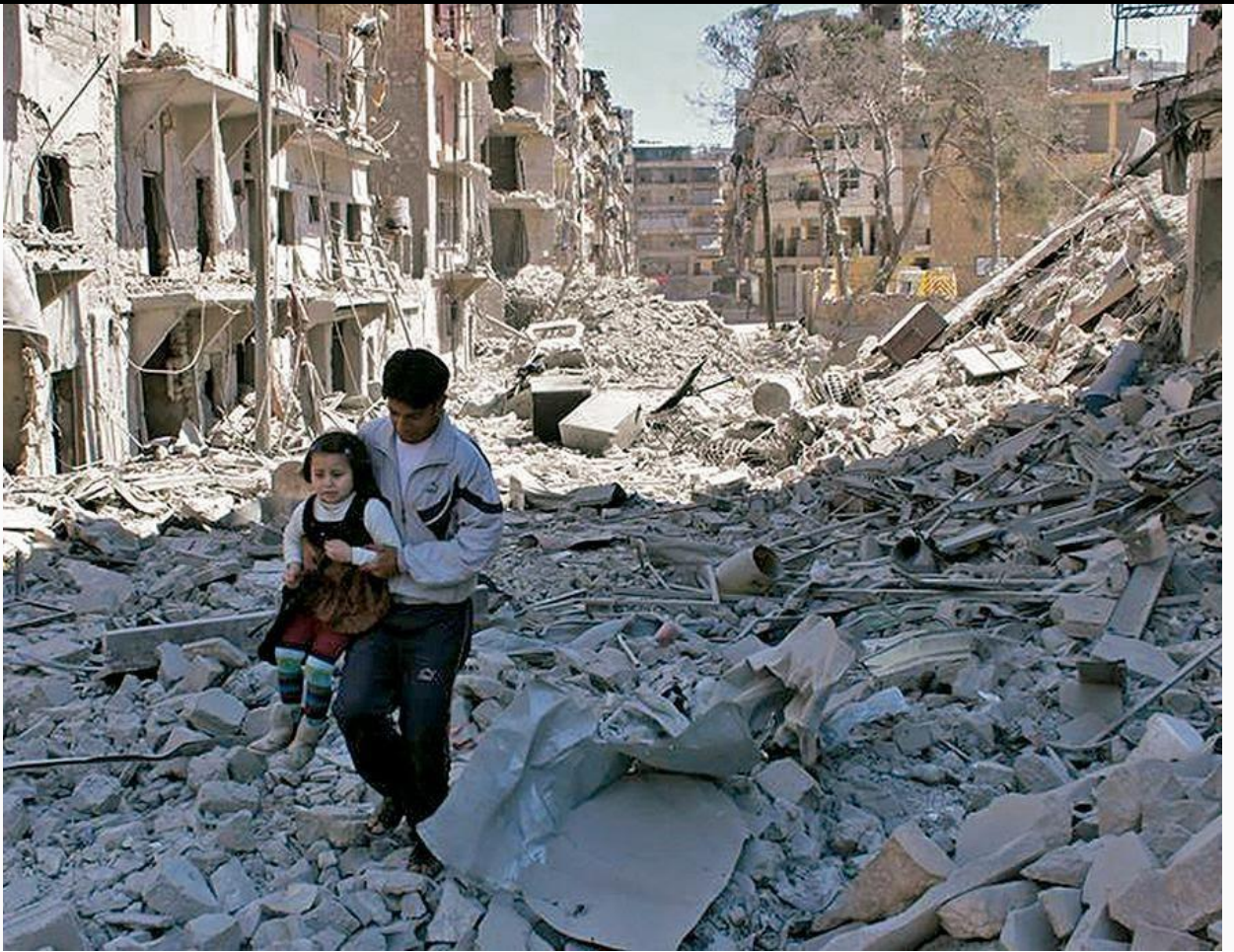
Bombardeig sobre Alep, Síria, l'abril de l'any 2014.

D'altra banda, sembla que una persona dolenta ha de ser la que té intencions malignes, independentment que les pugui dur a terme o que fracassi. Accentua el seu caràcter dolent el fet que gaudeixi amb el mal infligit.