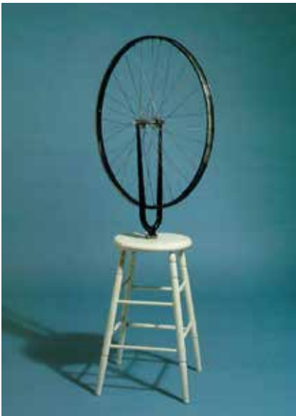
Roda de bicicleta, 1913