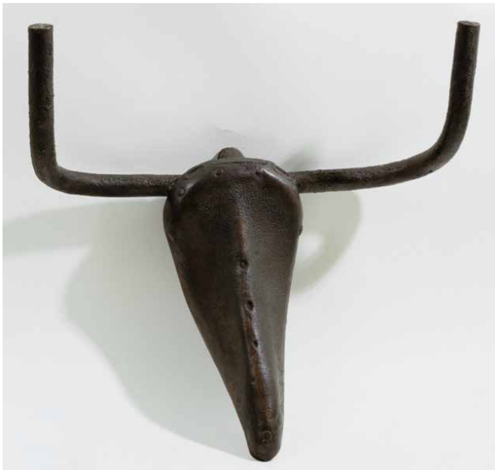
Picasso: cap de brau , 1940