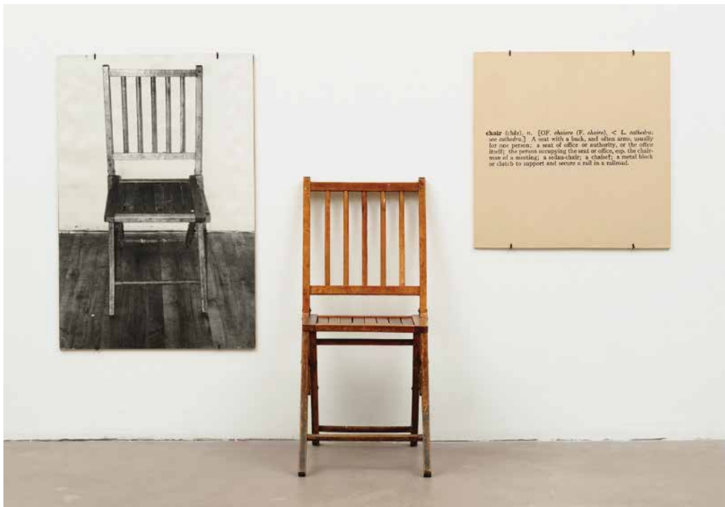
Joseph Kosuth. Una i tres cadires (1964)