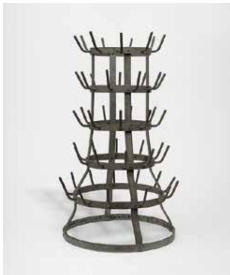
Porta ampolles, 1914