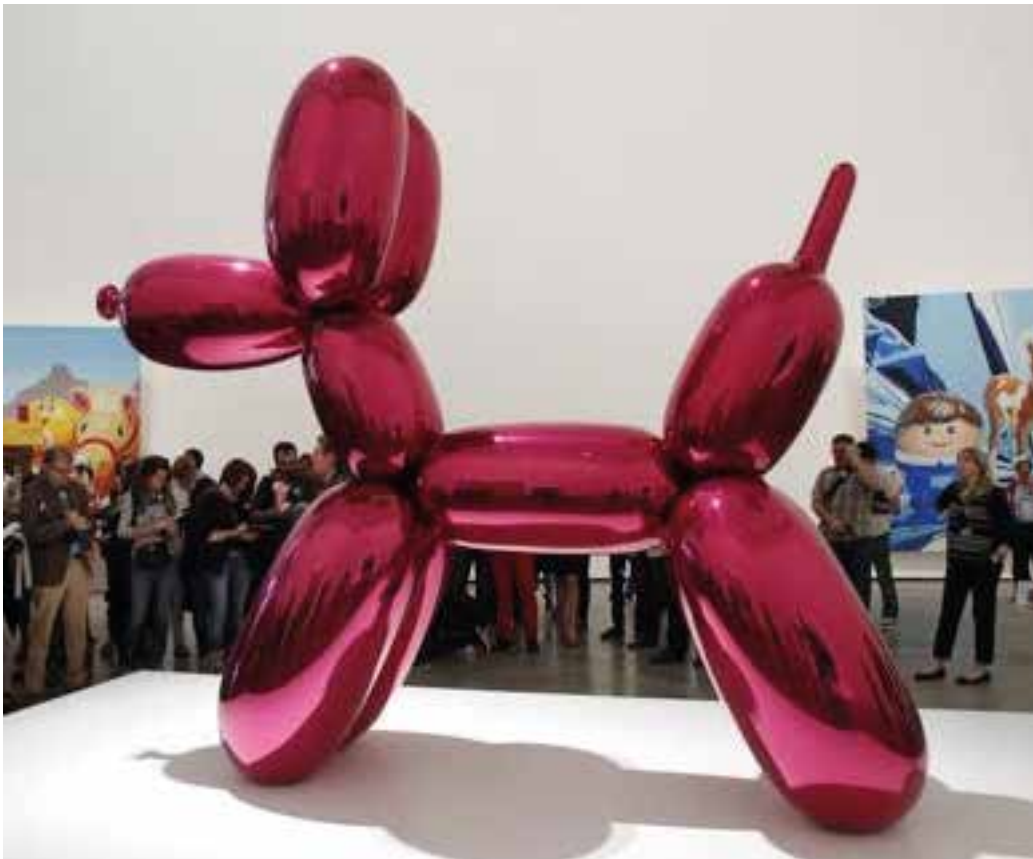
Jeff Koons: Gos globus , (1995)