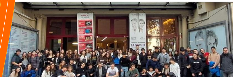
Març 2023. La Disputa entre Voltaire i Rousseau al Teatre Romea