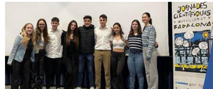
Treball de Recerca. Jornades Científiques de Badalona