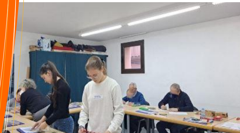
Reptes de Biologia. Col·laborem amb l'Associació de Malalts d'Alzheimer de Badalona