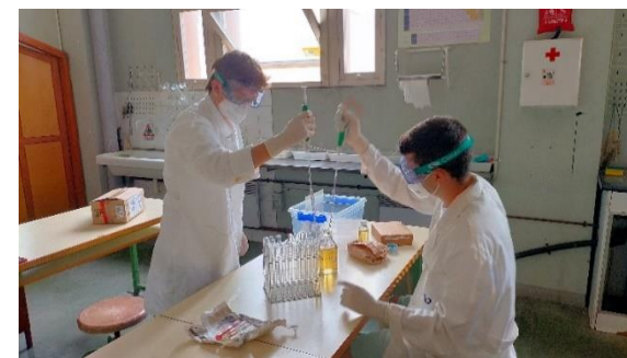
Treball de Recerca. Efecte antibiòtic dels remeis naturals