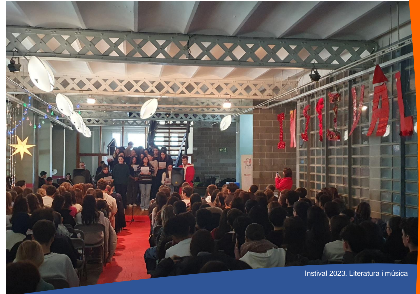
Instival 2023. Literatura i música