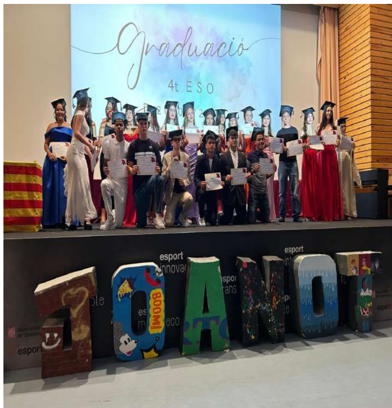
4t d'ESO C