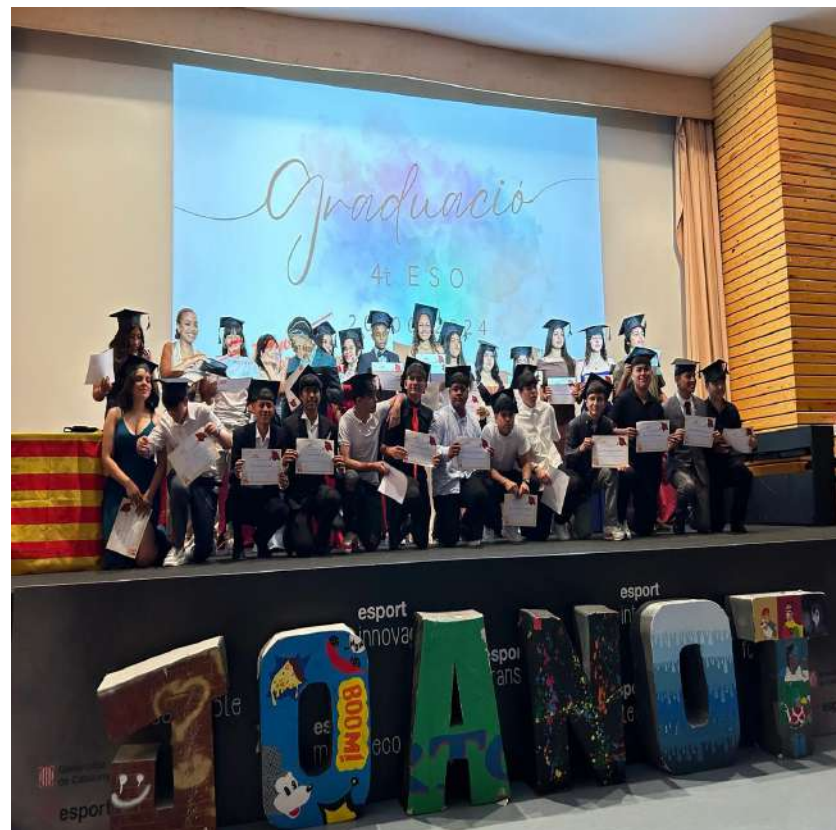
4t d'ESO B