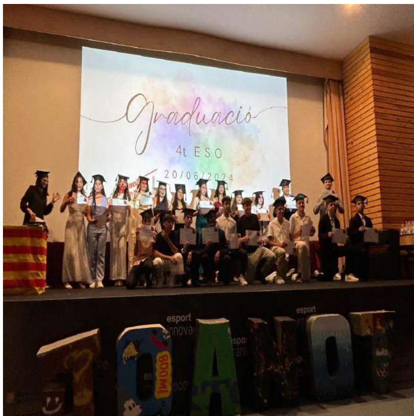
4t d'ESO A