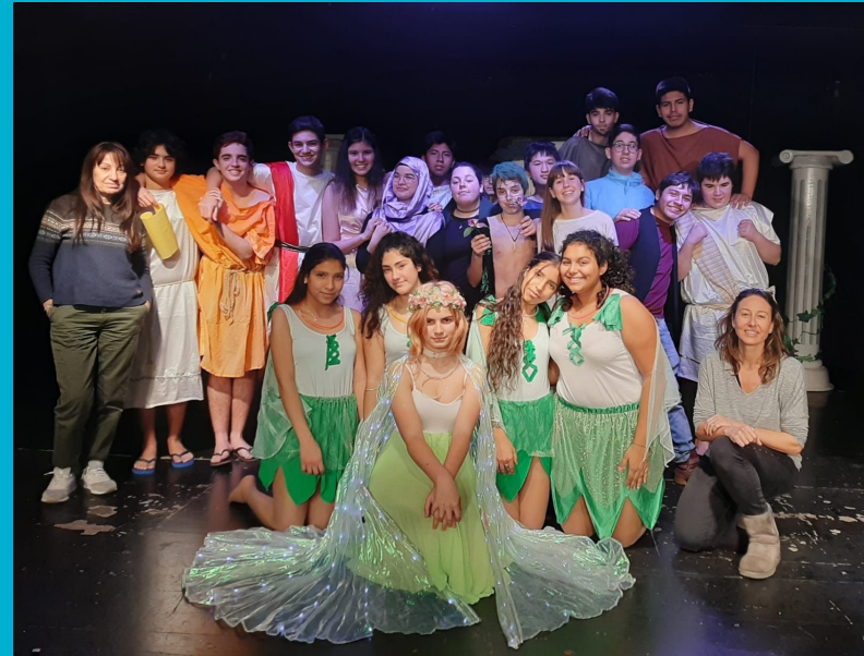
Midsummer Night's Dream - 2020