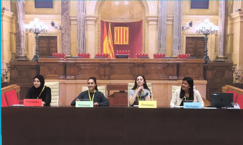
Visita al Parlament de Catalunya, 2019