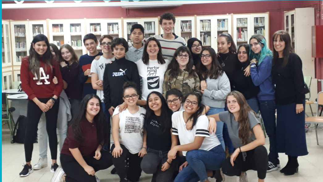
Masterclass de caracterització i tècniques d'improvisació