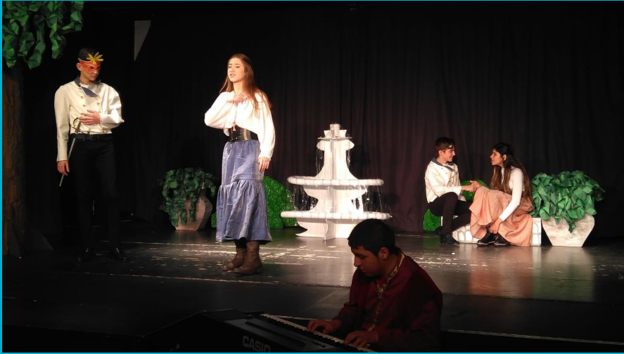
Much Ado About Nothing, 2019