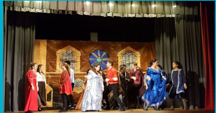
Romeo and Juliet, 2017