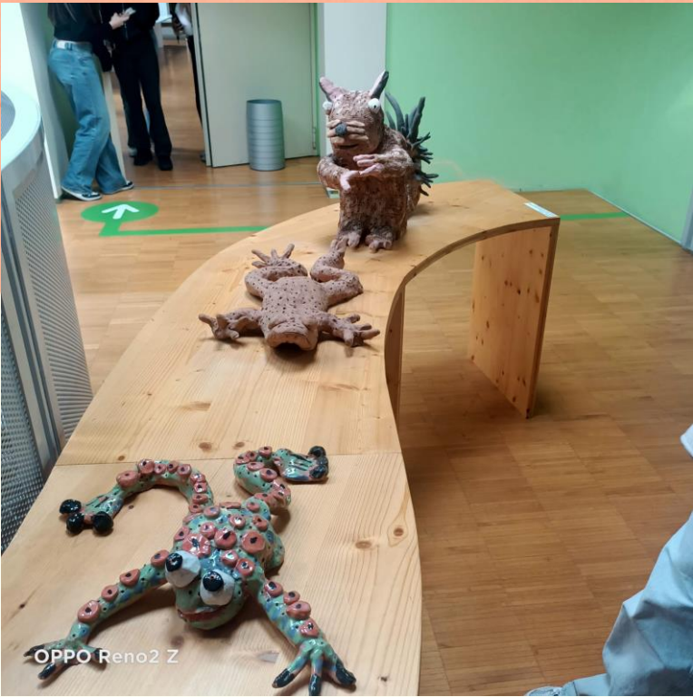
OPPO Reno2 Z