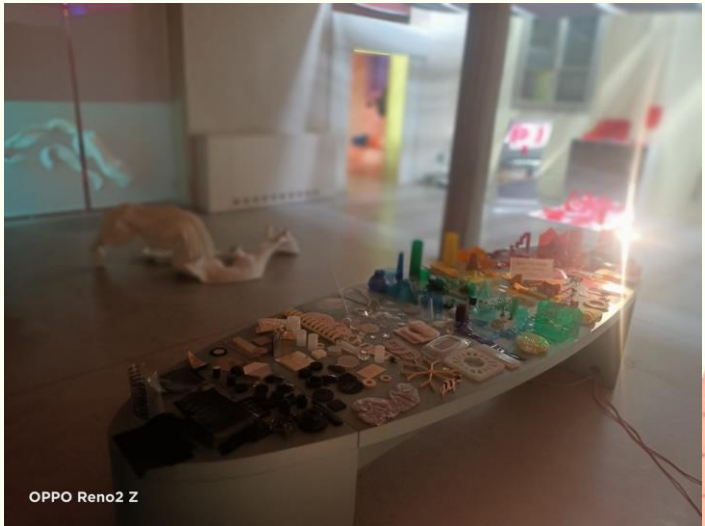
OPPO Reno2 Z