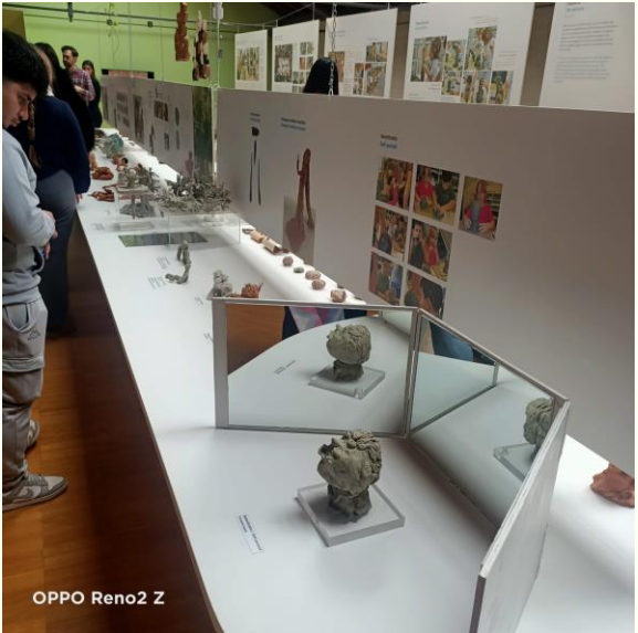
OPPO Reno2 Z