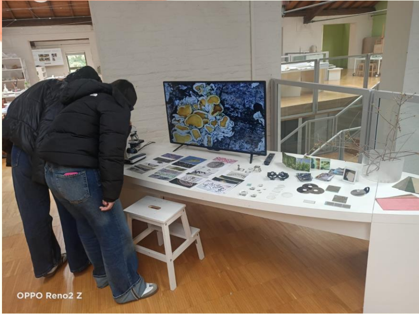
OPPO Reno2 Z