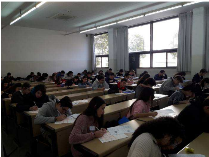
Moment de la prova teòrica a la Universitat de Barcelona