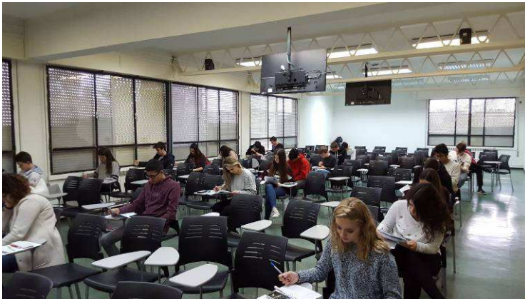
Alumnes realitzant la prova teòrica a la URV de Tarragona