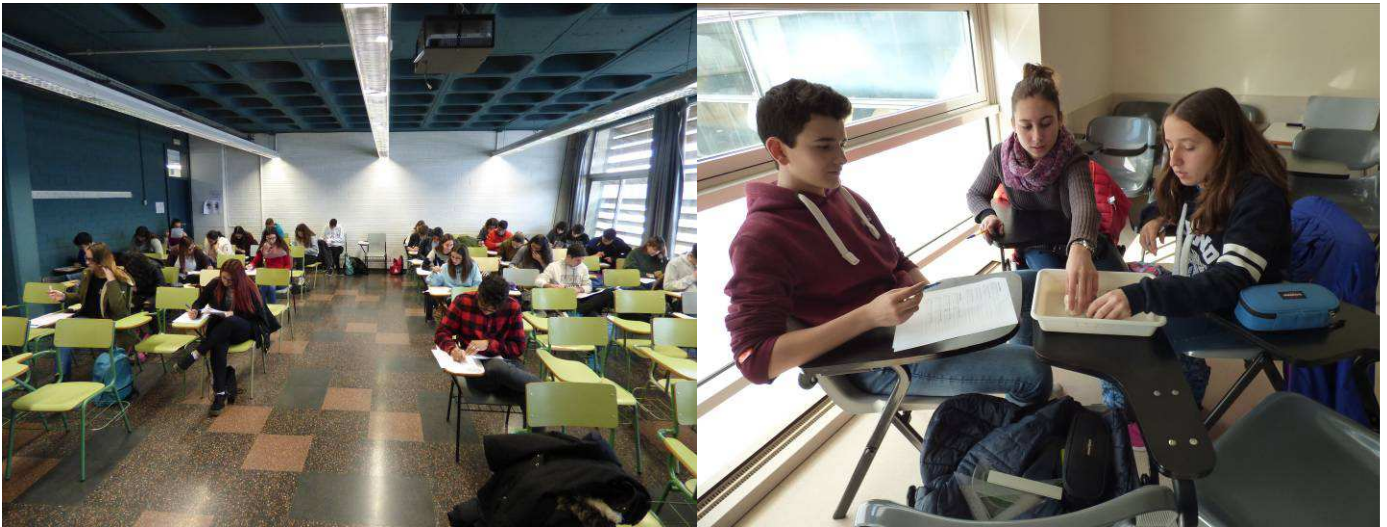
Foto de grup dels participants a les proves i els seus professors durant el descans entre prova pràctica i teòrica a Girona

A Girona la participació va ser de 143 alumnes procedents de 17 centres diferents, que van fer les proves a la facultat de Ciències de la Universitat de Girona. Aquest any l'extraordinària participació a Girona ha fet que l'organització convidi a 4 alumnes a participar a la final de Segovia