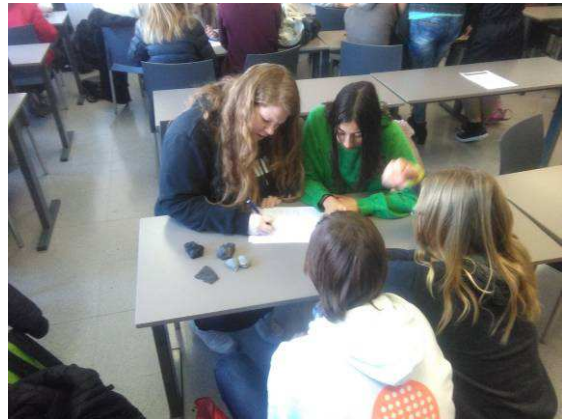
Alumnes realitzant la prova pràctica a la la UPC Manresa

A Lleida la participació va ser de 81 estudiants que van fer les proves a la Universitat de Lleida que també atorga el premi de la beca de matricula en el primer curs per estudiar a la universitat de Lleida