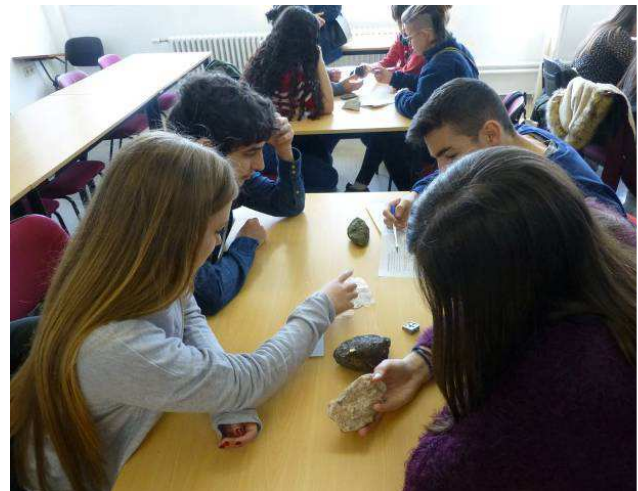
Alumnes durant la prova pràctica a la UAB, a Bellaterra