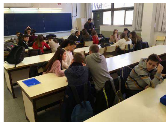
Alumnes resolent l'exercici pràctic a l'UB de Barcelona