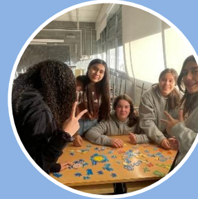
Final de curs