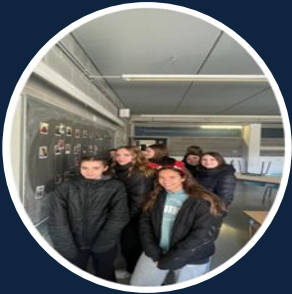
Gimcana de Nadal