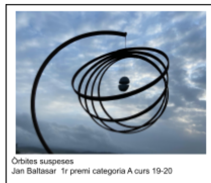
Orbites suspeses Jan Baltasar 1r premi categoria A curs 19-20

3a.- Es presentaran fotografies amb contingut matemàtic, de qualsevol indret.