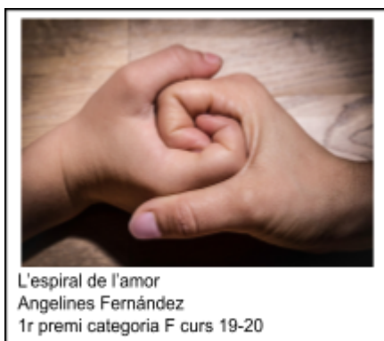
L'espiral de l'amor Angelines Fernández 1r premi categoria F curs 19-20

19a.- La participació en el present concurs implica l'acceptació d'aquestes bases.