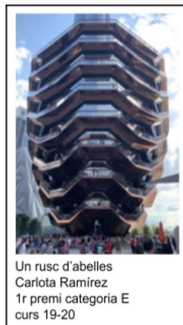
Un rusc d'abelles Carlota Ramírez 1r premi categoria E curs 19-20

16.- El lliurament de premis es farà el dimecres 16 d'abril de 2021, a les 19.00 hores, al teatre de Palafrugell, coincidint amb el lliurament del Premi Pla.