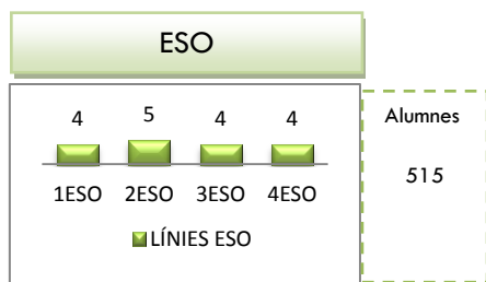
Taula 1. Distribució línies ESO i nombre alumnes. Dades curs 2018-19.

L' institut imparteix estudis d'Ensenyament Secundari Obligatori (ESO) i de Batxillerat en les modalitats de Tecnològic-Científic i Humanitats-Ciències Socials.