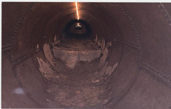
Canal de l'entrada d'aigua