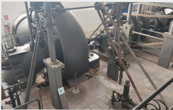
Turbina i politjes de la màquina hidràulica