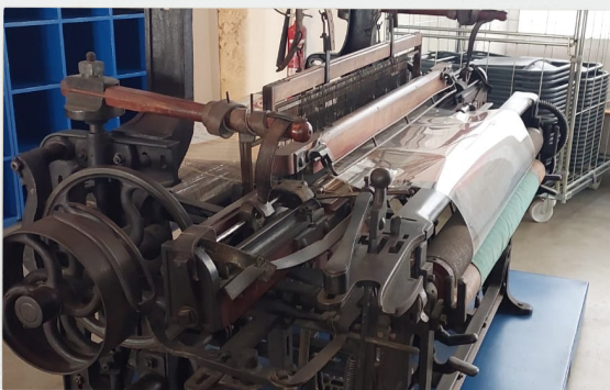
Imprescindibles per a fer les teles