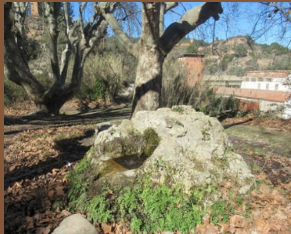
FONT DE LA BARONA

És una font de la vila i antic terme de Figuerola d'Orcau, actualment pertanyent al municipi d'Isona i Conca Dellà. Les seves aigües alimenten lo Torrent, que és la capçalera de la Segla de les Bassades.