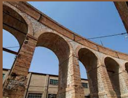
AQÜEDUCTE DE LA COLÒNIA SEDÓ

És una construcció de pedra per on pasava l'aigua que anava cap la fàbrica ja que hi havia una torbina hidràulica.