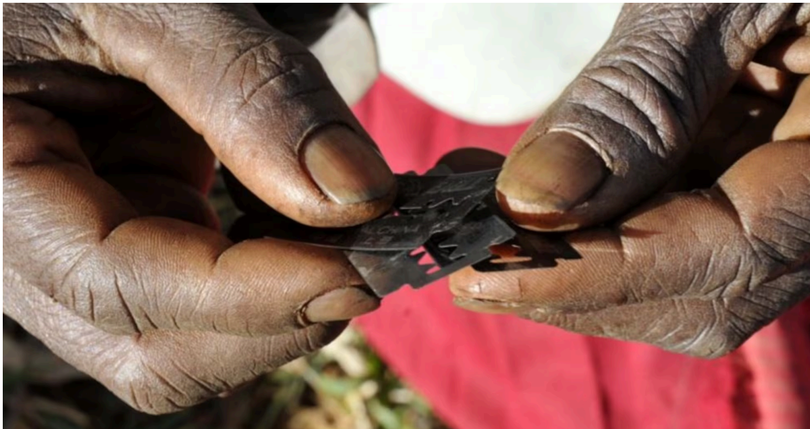
Eina que s'utilitza per realitzar la mutilació genital.

La mutilació genital femenina té el seu origen en el segle Vac. i des de sempre ha format part de moltes cultures. Erradicar-la permetrà evitar problemes de salut i d'exclusió social que pateixen totes les noies mutilades.