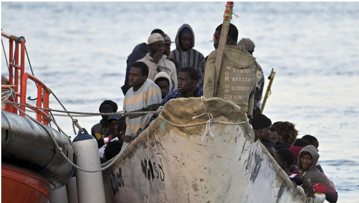
Persones emigrant per feina.

Espanya no sempre ha estat un país receptor d'immigració. Durant gran part del segle XX, molts espanyols emigraven a altres països d'Europa o d'Amèrica per trobar feina. Però a partir de finals dels anys noranta i principis dels 2000 la situació va canviar. L'economia espanyola estava creixent i es necessitaven treballadors en sectors com la construcció, l'agricultura, l'hostaleria o la cura de persones grans. Això va fer que moltes persones de països d'Amèrica Llatina, del nord d'Àfrica o d'Europa de l'Est vinguessin a Espanya per treballar. A més, el fet que la població espanyola estigui envellint i que neixin menys nens fa que la migració laboral sigui cada vegada més important per mantenir l'activitat econòmica.