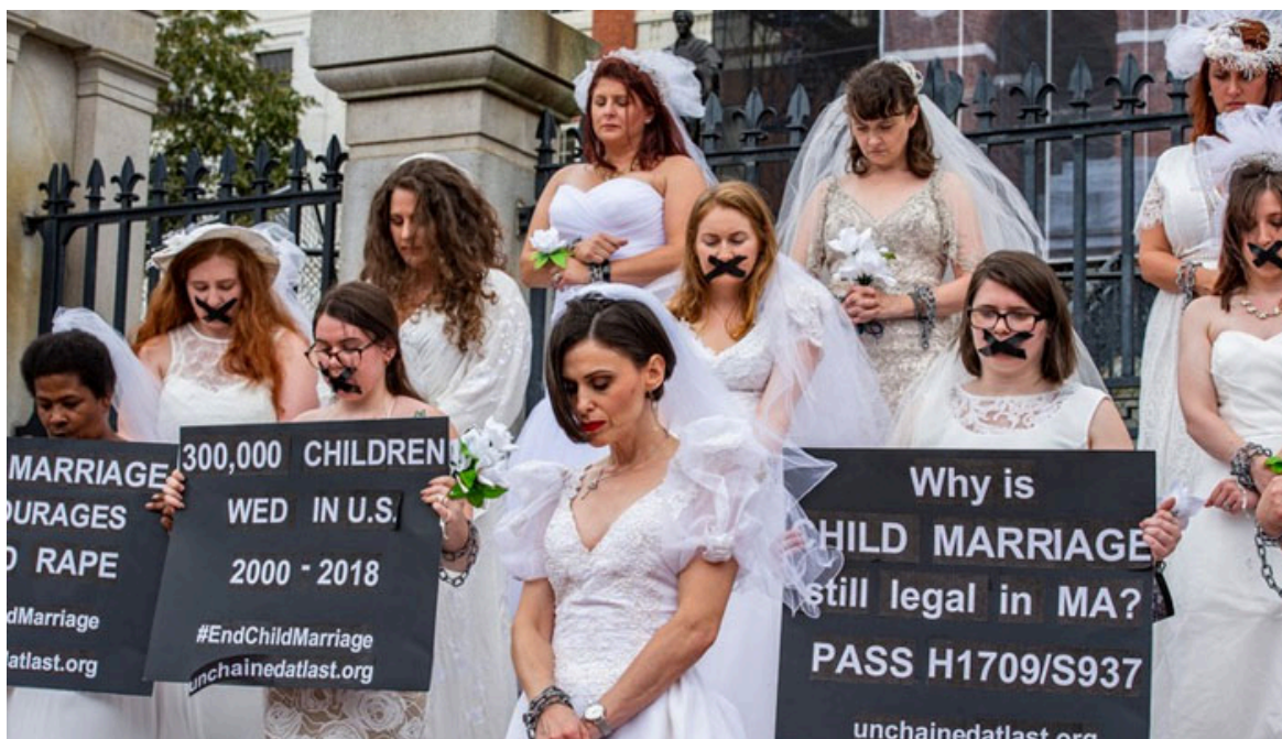
Manifestació contra el matrimoni infantil

El matrimoni infantil és un problema, que encara que no sembla de l'actualitat, envolta fins i tot als països més desenvolupats com Estats Units. Aquesta pràctica que afecta sobretot les nenes, és una violació dels drets humans, ja que empitjora la seva educació, salut i dignitat.