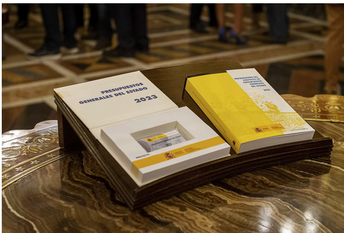
Últims pressupostos generals de l'Estat aprovats en 2023

Espanya afronta una problemàtica amb els pressupostos generals de l'Estat des del 2023, ja que aquell va ser l'últim any que es van renovar. Aquesta manca de renovació de pressupostos i la poca expectativa que hi ha sobre que es renovi en aquest any comporta una sèrie de possibles conseqüències negatives.