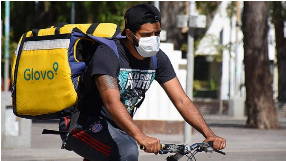
No és job hopping, és precarietat laboral juvenil

A Espanya, els joves han tornat a entrar al mercat laboral després de la crisi econòmica, però molts encara viuen una realitat de contractes temporals, jornades parcials involuntàries i sous per sota de la mitjana. Malgrat la recuperació de l'ocupació general, la precarietat juvenil continua sent un dels principals reptes socials i econòmics del país.