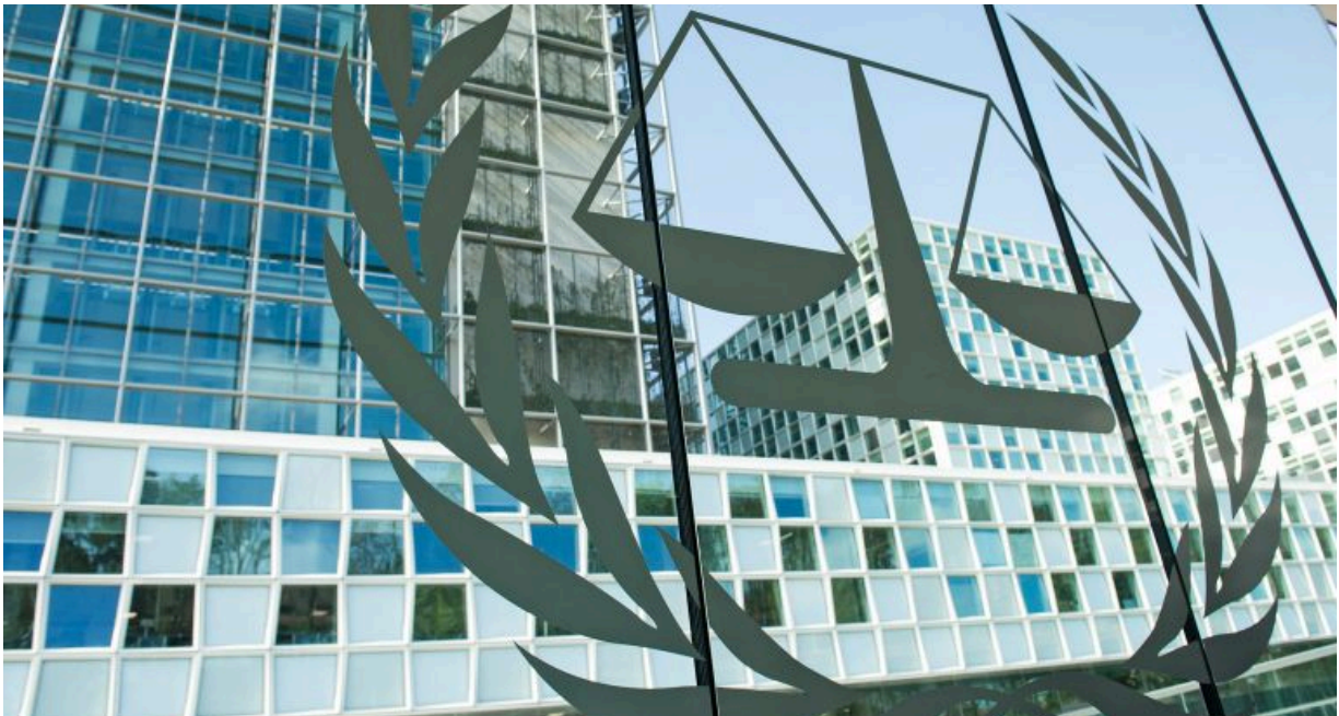
La seu de la Cort Penal Internacional, a La Haia.

La manca de cooperació dels estats, els interessos geopolítics i el poder de les grans potències han convertit la justícia internacional en un sistema desigual, sovint simbòlic i incapaç de protegir les víctimes quan el dret entra en conflicte amb la força.