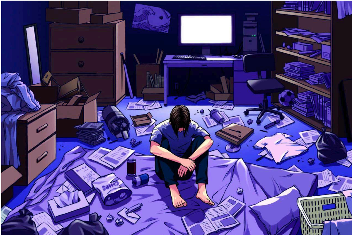
Dibuix representatiu del fenomen hikikomori