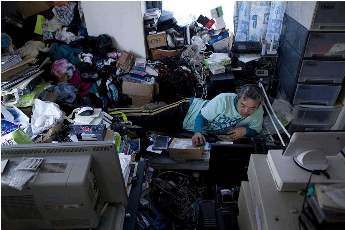
Home treballant en un entorn d'extrema saturació

En el segle XXI, malgrat el seu alt nivell de desenvolupament tecnològic i econòmic, el Japó s'enfronta a una profunda crisi de salut mental marcada per l'aïllament social, l'estigma emocional i l'ús excessiu de la tecnologia.