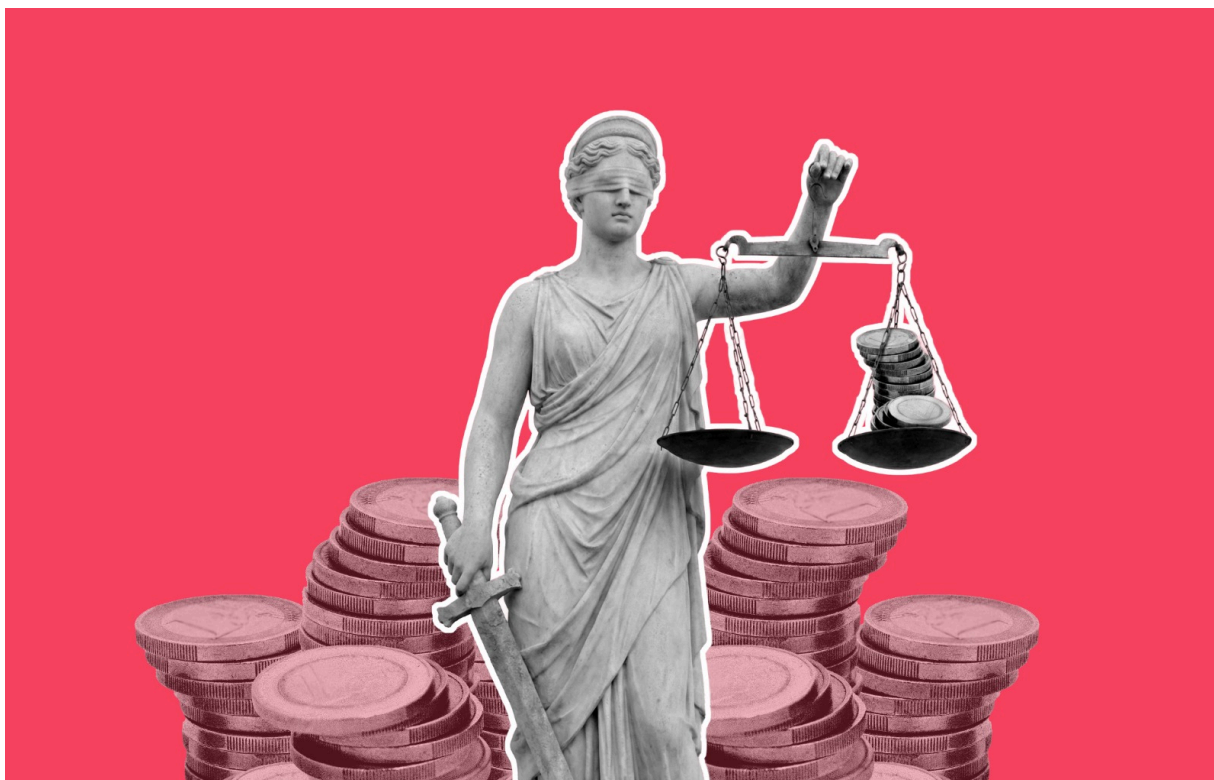
Figura de Themis, coneguda com “la dama de la justícia”.

La justícia no falla per absència de lleis, sinó per la seva aplicació desigual. En aquest context, accedir-hi depèn més de la posició social que no pas del principi d'igualtat davant la llei.