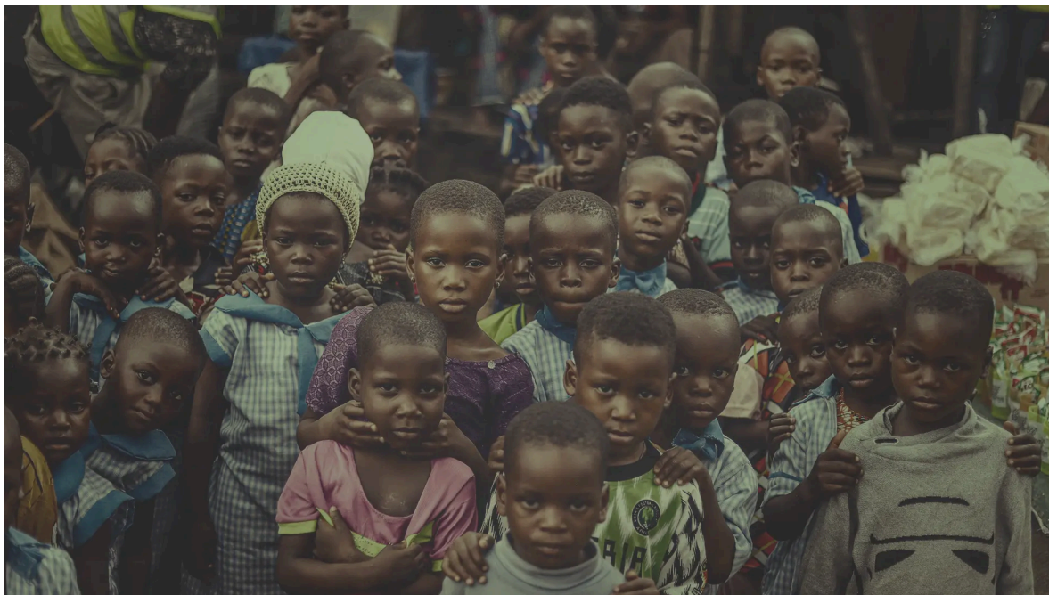
Pobresa infantil a l'Àfrica

Una crisi humanitària que compromet el futur de generacions senceres. Milers de nens i nenes pateixen diàriament una pobresa extrema difícil de combatre.