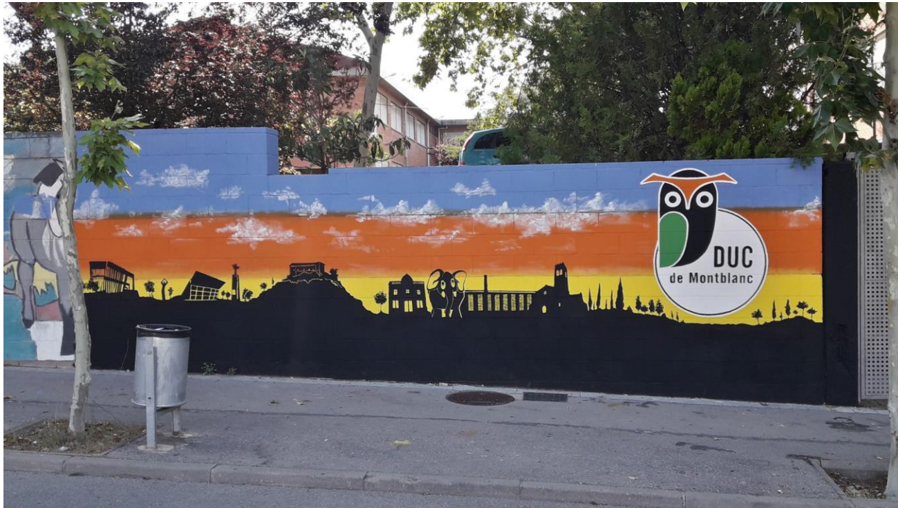
Institut Duc de Montblanc Rubí