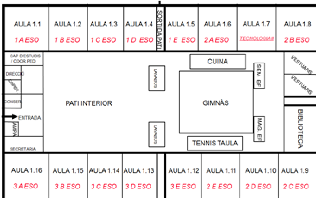
DISTRIBUCIÓ D'ESP AIS . PLANTA BAIXA. CURS 2021-2022