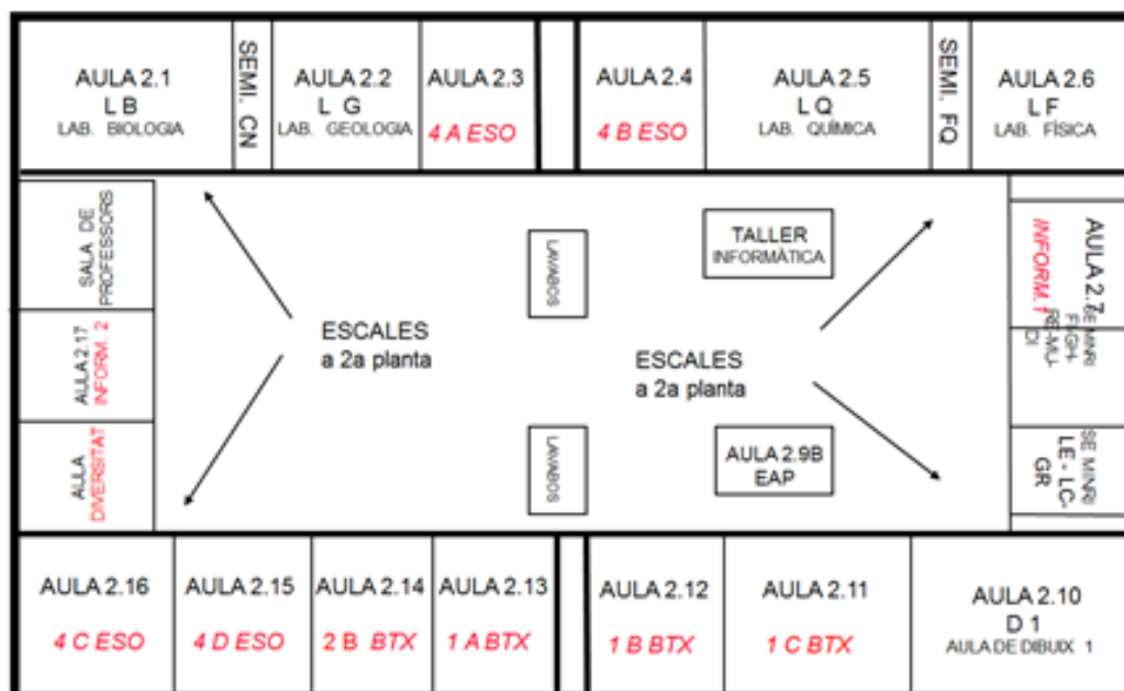
DISTRIBUCIÓ D'ESP AIS . PRIMERA PLANTA. CURS 2021-2022