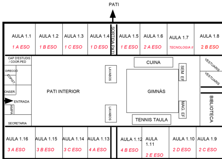
DISTRIBUCIÓ D'ESP AIS . PLANTA BAIXA. CURS 2020-2021