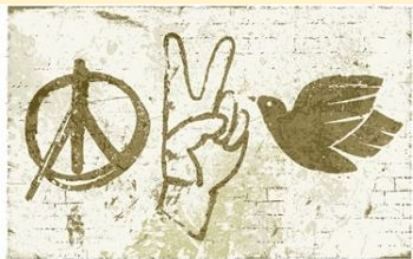
Dia de la NO VIOLÈNCIA Dia de la Pau