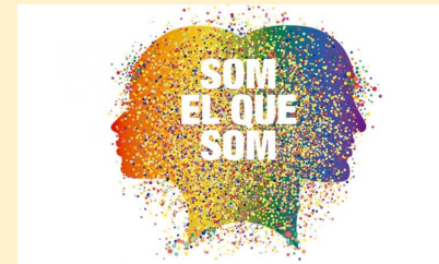
Dia internacional contra la LGTBIFÒBIA