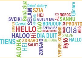
Dia europeu de les llengües