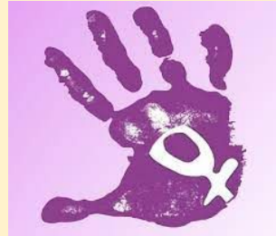
Dia de la Dona