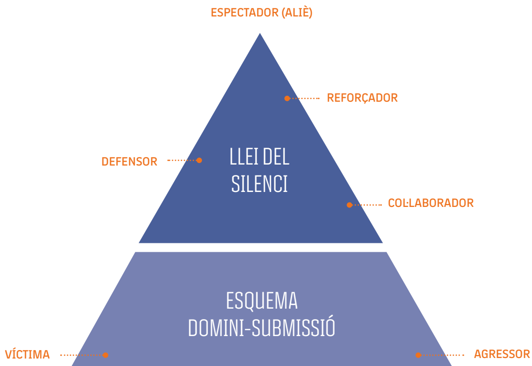
Gràfic 1. Esquema del bullying (Ortega, 2005)

A més de saber a través de quines formes es pot manifestar el fenomen del bullying, hem de tenir en compte qui són els participants d'una situació de bullying (veure gràfic 1).