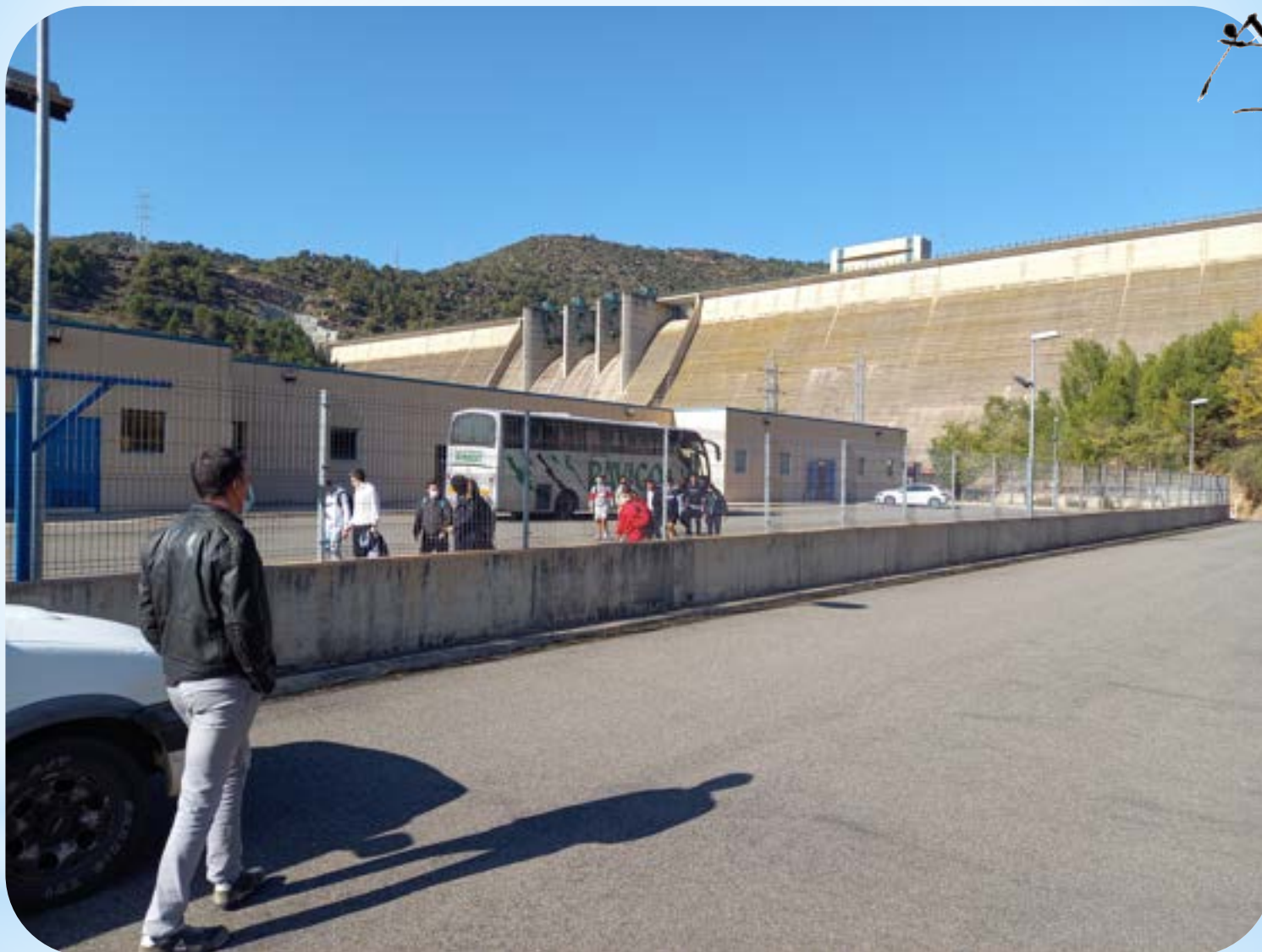
* LA PRESA VISTA DES DE LA BASE