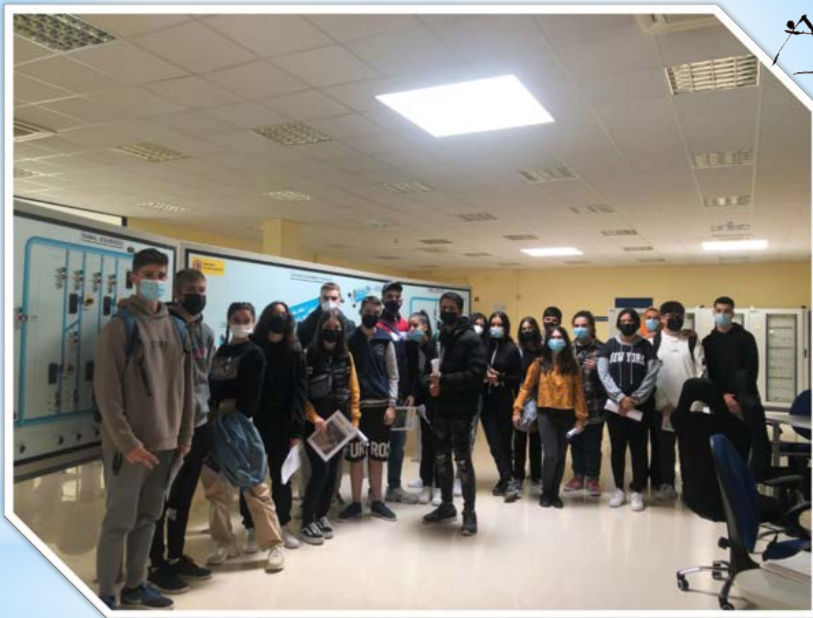
* SALA DE CONTROL