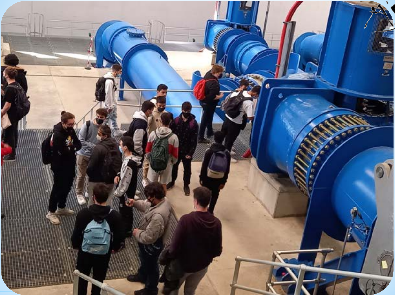
* SALA DE BOMBES