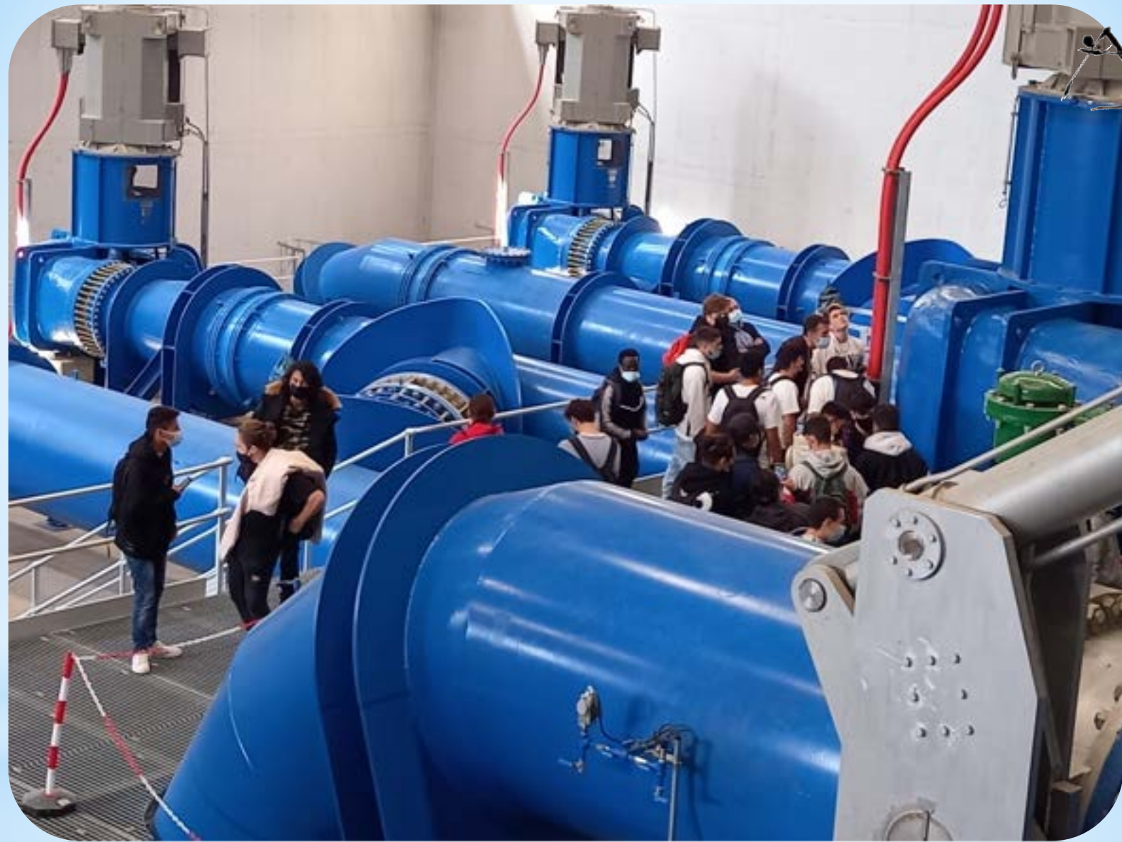
* SALA DE BOMBES