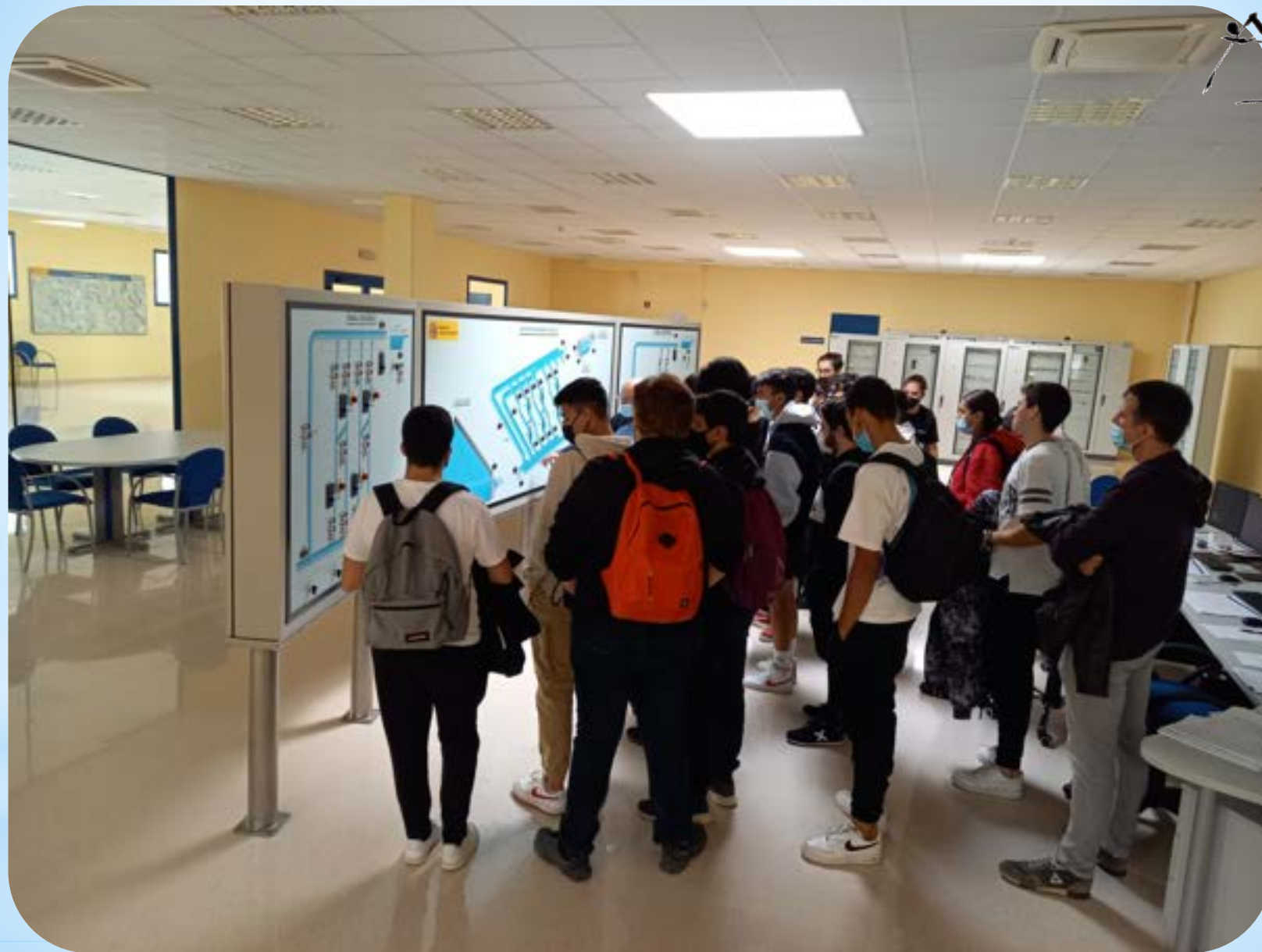
* SALA DE CONTROL